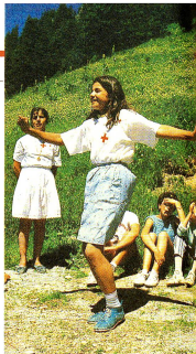
Una delle due sorelle curde esegue una danza tradizionale, un chiaro messaggio di gioia, un'esultanza dalla realtà di un'esistenza difficile.

La preparazione di formaggio, in un alpe nella vicinanza del campo, ha suscitato curiosità di grandi e piccoli.