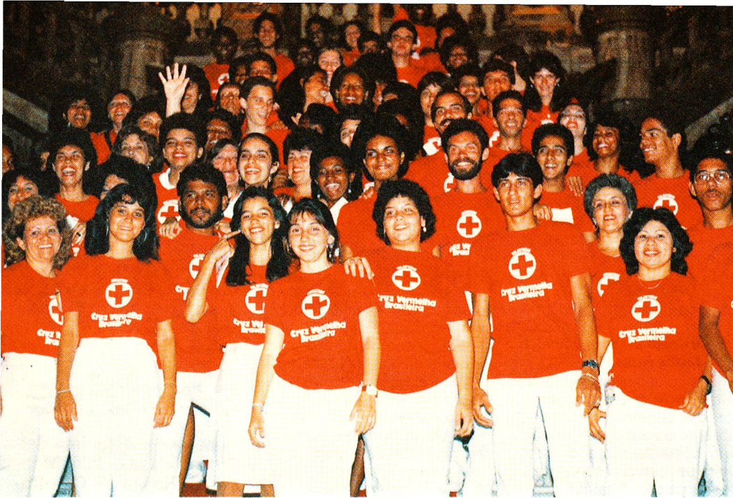
Ai volontari della Croce Rossa brasiliana il merito d'essersi occupati dell'organizzazione e degli ospiti dell'incontro internazionale.