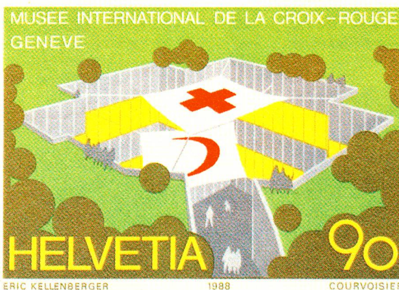
Francobollo realizzato da Eric Kellenberger di Corseaux VD per l'inaugurazione del Museo internazionale della CR

Filatelia Croce Rossa – Intervista a Karl Kennel, nuovo presidente di CRS – Padrinati