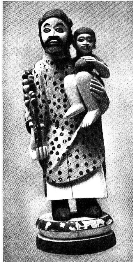
Abb. 3. Lyoner Missionare, Dahomey. Der hl. Josef (Holzschnitzerei).

Bedeutend besser liegen allenthalben die Verhältnisse auf den Gebieten der religiösen Kleinkunst und des Kunstgewerbes , wozu ich auch die religiösen Skulpturen zähle. Abgesehen von den erwähnten, stark europäisierten Versuchen der religiösen Plastik haben einzelne Missionare auch hier den Weg zu einer wirklich bodenständigen religiösen Kunst gefunden, so die Missionare von Lyon in Dahomey, wo sich gerade dank der Arbeit der Missionare eine starke Rückbesinnung auf die alten Kulturgüter des Landes zeigt (Abb. 3), oder in Benin, wo mit Erfolg auf die Struktur und Haltung der alten Beninkunst zurückgegriffen wird (44). Auch Java besitzt bereits eine eigene katholische Schnitzerschule, die in bewußter Anlehnung an die altjavanische Kunst bereits eine Anzahl schöner Werke schuf (45). Innerhalb dieser Kunstgattung nehmen die Kruzifixe eine Ausnahmestellung ein. Bei ihnen sind Inhalt und auch die wesentliche Form durch die christliche Tradition bestimmt, so daß Vorbilder aus der heidnischen Plastik nicht in Frage kommen. Und doch haben einheimische Künstler Kreuzes-