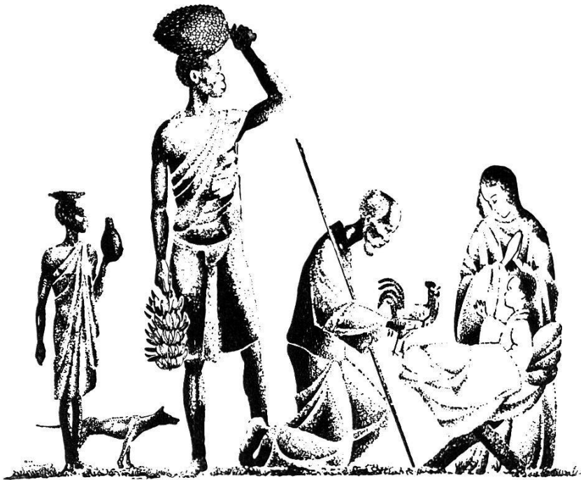
Abb. 6. P. Vandenhoudt: Die Anbetung der Hirten.

nach seinem eigenen Geständnis den Weg, durch Verzicht auf alle überflüssigen und entbehrlichen Einzelheiten und durch alleinige Herausstellung der handelnden Personen ein Geschehnis zwingend einfach und klar wiederzugeben. Das sind bewußte Illustrationen, bewußte Deuter der Bibel und keine nach irgendeiner besonderen Stimmung strebende Malerei. In dieser Art hat P. Vandenhoudt beliebige Szenen aus dem Alten und Neuen Testament wiedergegeben und damit echte Beweise einer guten afrikanischen Bibelillustration geschaffen (52).»