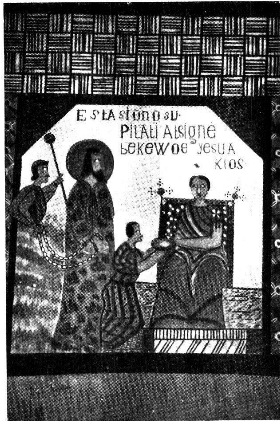
Abb. 1. Max Mintsa: 1. Kreuzwegstation in Omvan (Kamerun).

Bei der Architektur muß stets vor Augen gehalten werden, daß das christliche Kultgebäude als sakraler Raum Forderungen an die Kunst stellt, die nicht ohne weiteres in jedem Lande in bodenständiger Form erfüllt werden können. Es gibt Länder in den Tropen, die einen eigenen Baustil entwickelt haben, der auch von Missionaren in großherziger Weise übernommen wurde. So schuf der Islam in Nordafrika einen Baustil, der sich in abgewandelter