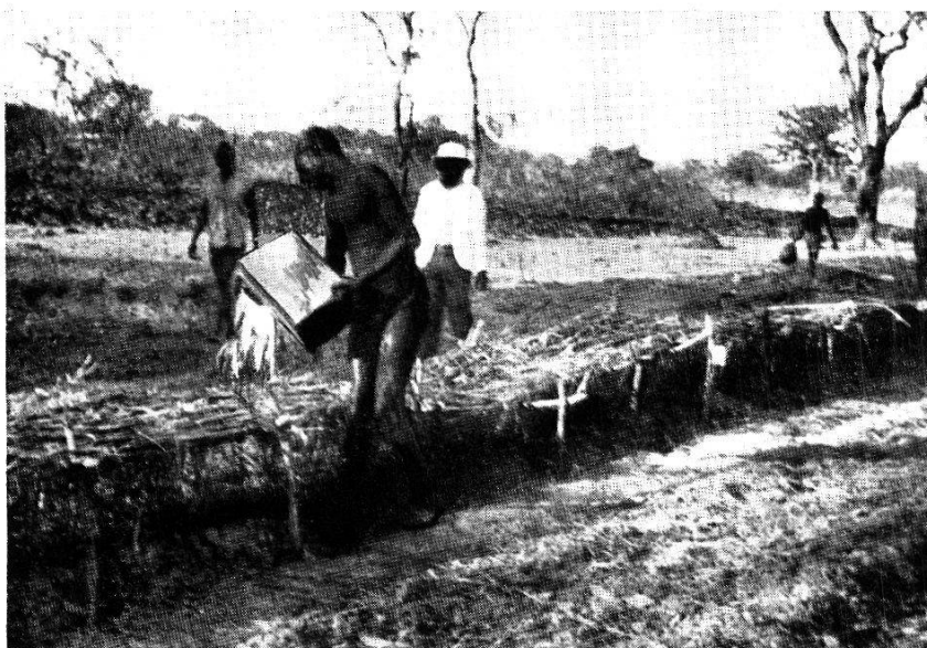
Fig. 109. Installation de cultures sur des terrains aménagés où les Tsétsés pullulaient avant les travaux de prophylaxie agronomique.