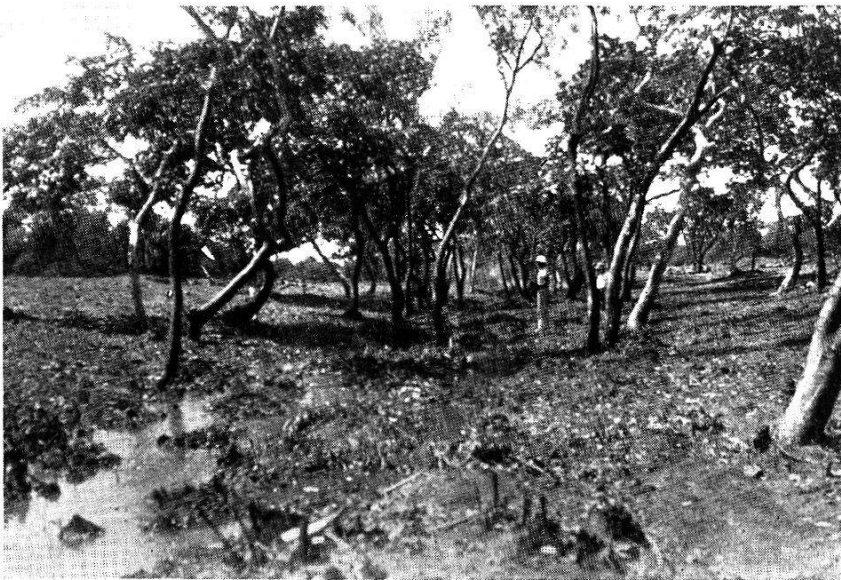
Fig. 108. Le marigot (fig. 105) après les travaux de prophylaxie agronomique.