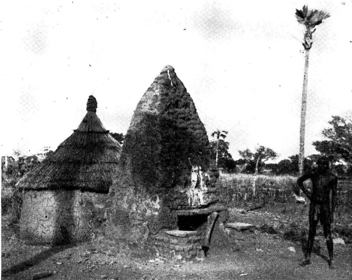
Fig. 2. Case de fétiche de chasse en Haute-Volta.

rant, le chasseur avant de prendre la piste passe sous le « dome » (nom vernaculaire de l' Erythrophleum ) où repose Balibé et dépose à côté de lui quelques kolas, voire de l'argent, en faisant la promesse de l'honorer à son retour après avoir tué beaucoup de gibier.