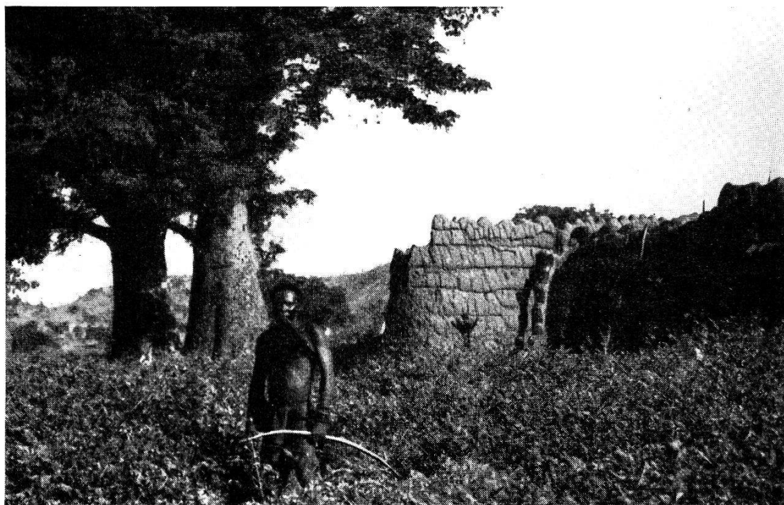
Fig. 3. Chasseur Lobi.

répand sur les animaux, les végétaux, etc... touchés par eux ». Certains animaux sont réputés leur appartenir : ils sont aussi porteurs de gnama et communiquent ce dernier à quiconque les touche.