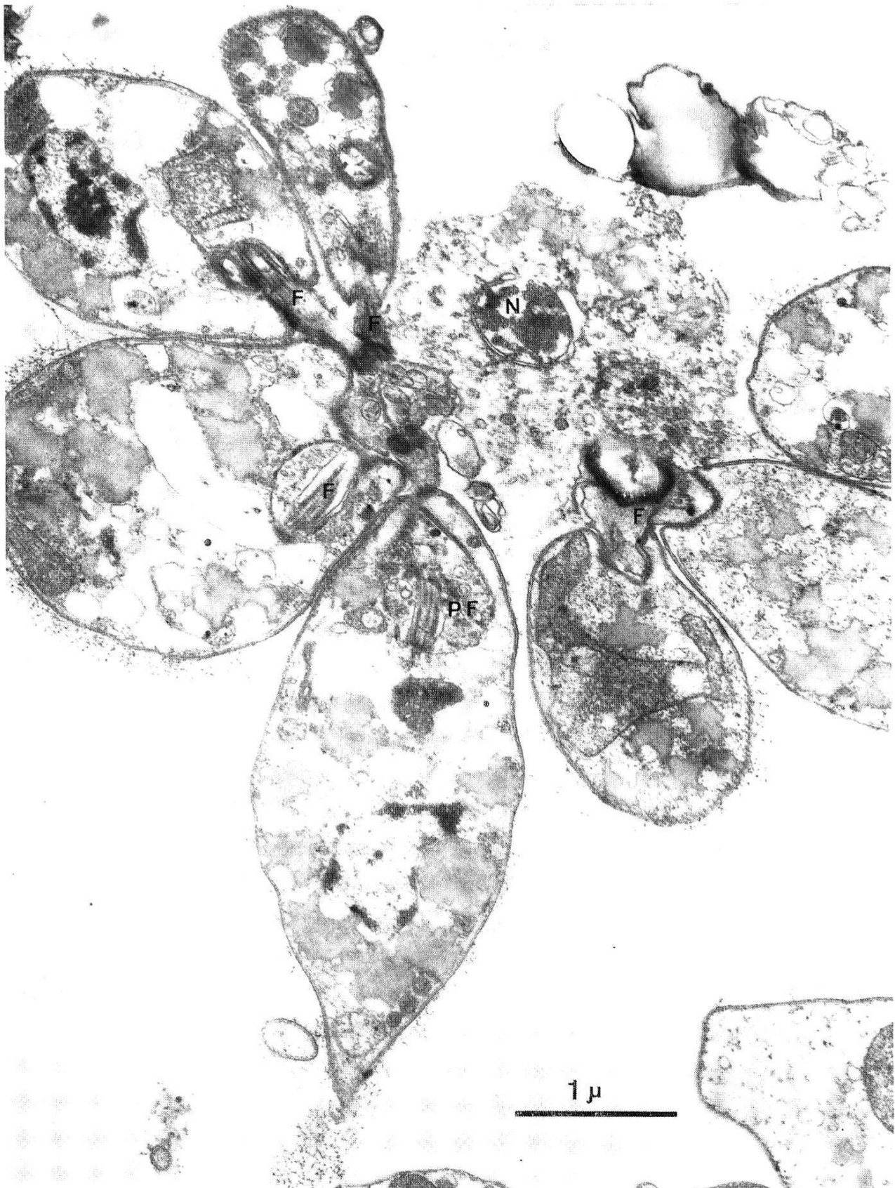
Fig. 2. Coupe à travers une rosace de Leptomonas ctenocephali . Le centre de cette rosace est occupé par un leptomonas lysé dont on distingue encore très bien le noyau (N) et la membrane nucléaire. Les leptomonas vivants orientent tous leur flagelle (F) et avec lui leur poche flagellaire (PF) vers la cellule lysée. Chez deux des leptomonas vivants, la poche flagellaire est occupée par de nombreux organites, provenant de la cellule lysée.