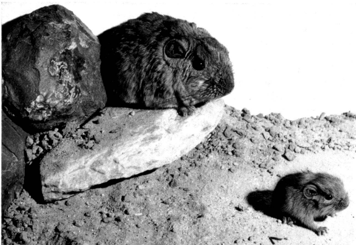
Fig. 2. Goundi sur un rocher, surveillant son petit.