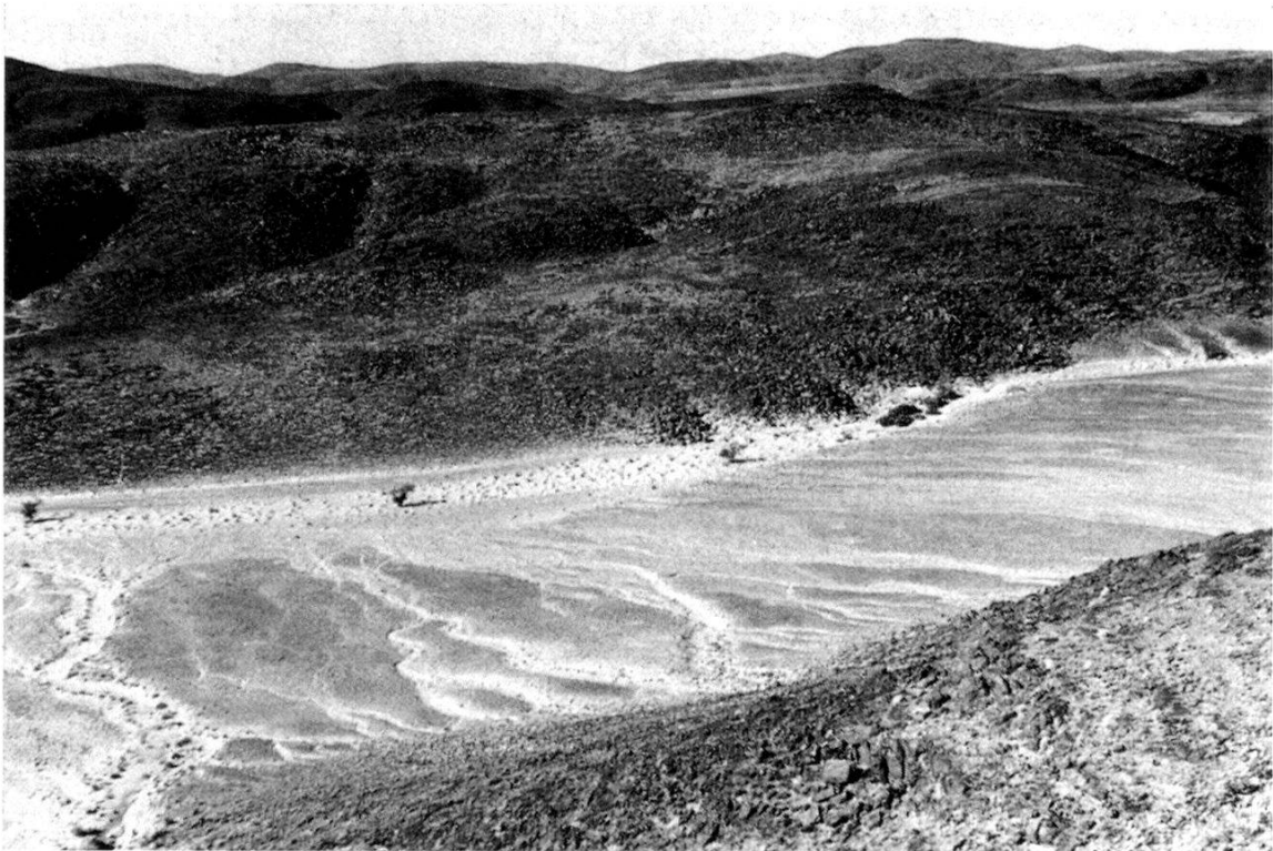
Fig. 1. Milieu rupestre où vivent le Goundi ( Ctenodactylus vali joleaudi ) et Uromastix ( U. acanthinurus ), dans les Monts d'Ougarta au Sahara nord-occidental.