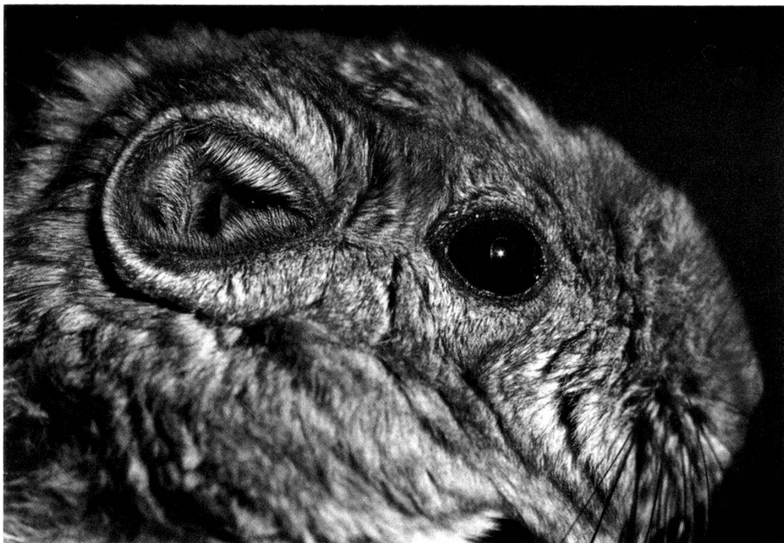
Fig. 3. Tête de Goundi (vue latérale).

Les Ctenodactylidae actuels montrent une répartition souvent limitée et même insulaire; certaines espèces apparaissent comme de véritables reliques (HEIM DE BALSAC, 1936). Les genres diffèrent l'un de l'autre par leur denture et la structure du squelette.