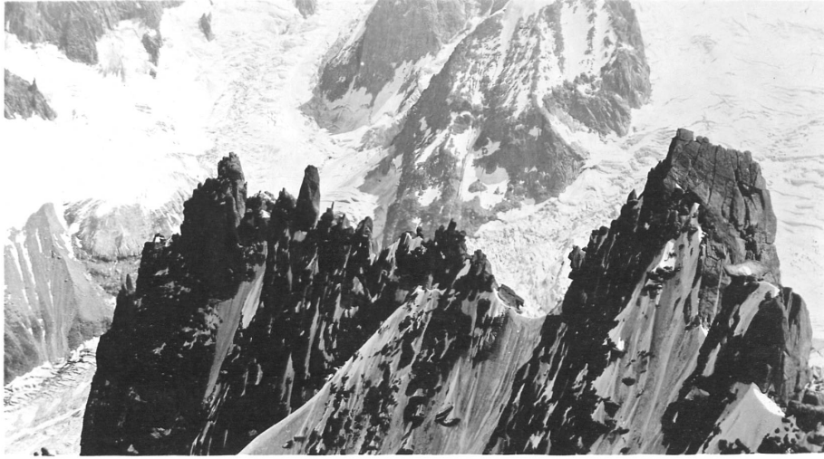
Pain de Sucre, Dt. du Requin von Aiguille du Plan