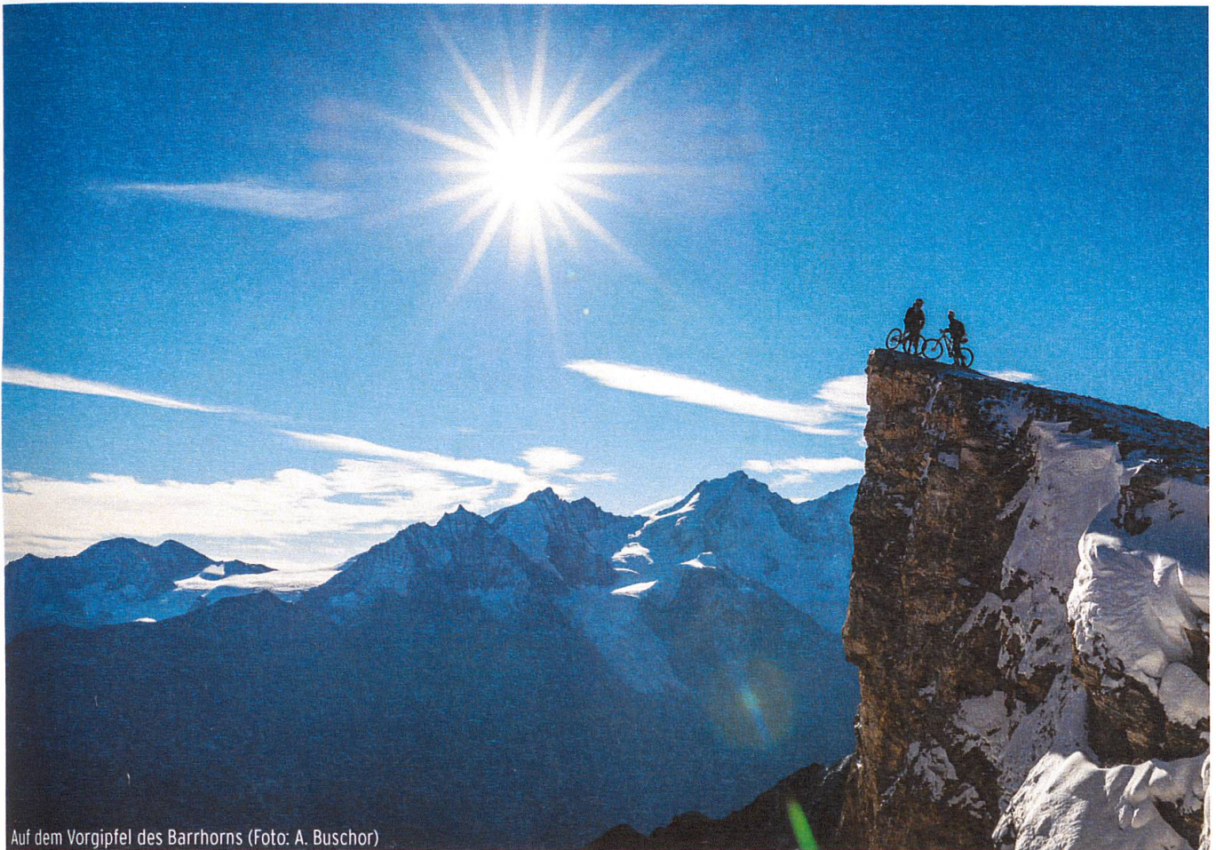
Auf dem Vorgipfel des Barrhorns