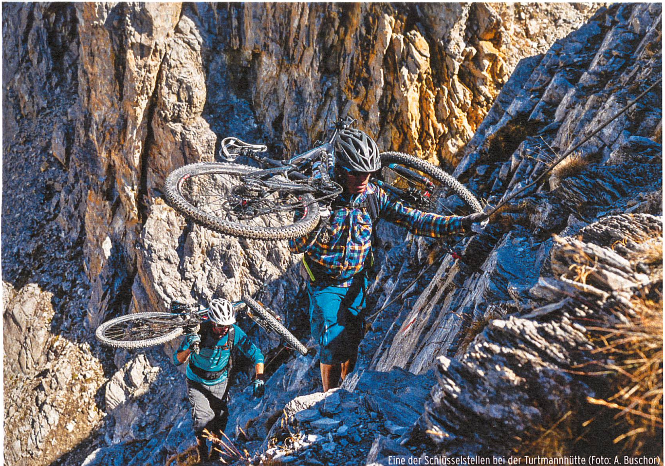
Eine der Schlüsselstellen bei der Turtmannhütte