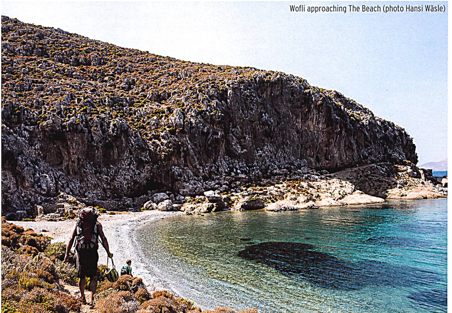
Wofli approaching The Beach