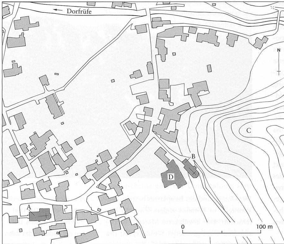
Abb. 77: Trimmis, ev. Kirchgemeindehaus. Planausschnitt von Trimmis mit Lage der beiden Kirchen, der Burgstelle und der Grabungsfläche. A: Katholische Pfarrkirche St. Carphorus; B: Evangelische Pfarrkirche (früher St. Leonhard); C: Burgstelle; D: Grabungsareal. Mst. 1:3000.

bäudestrukturen waren aber nicht zu finden. Vereinzelt auftretende Keramikscherben datieren diese frühesten Befunde in die späte Bronzezeit, d. h. in den Zeitraum von 1300 bis 800 v. Chr.