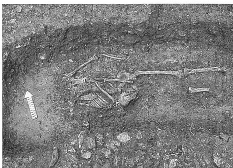
Abb. 82: Trimmis, ev. Kirchgemeindehaus. Teilweise gestörtes Erwachsenengrab. Blick von Süden.

Mit welchem grossen Interesse die Trimmiser Bevölkerung die archäologischen Grabungen verfolgte, wurde während einer öffentlichen Führung im Frühjahr 2000 deutlich. An zwei Tagen orientierten wir überdies die Schülerinnen und Schüler, welche klassenweise die Grabung besuchten. Ein Lehrer der damaligen 1. Sekundarstufe nahm diese Führung zum Anlass, seine Klasse einen Aufsatz zum Thema "Sensation in Trimmis" schreiben zu lassen. Als Ergebnis entstand eine einzigartige, wundervolle Sammlung von Kurzgeschichten, die ich auf keinen Fall vorenthalten möchte. Stellvertretend für alle Arbeiten folgen nun zwei Aufsätze, wobei die Auswahl wirklich nicht leicht fiel.