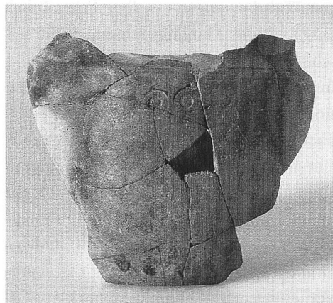
Abb. 78: Trimmis, ev. Kirchgemeindehaus. Fragment eines ältereisenzeitlichen Töpfchens vom Typ "Tamins". Gefäßhöhe Boden bis Schulter: 8,7 cm.

Periode, während derer bestehende Geländemulden mit feinsandigem Ablagerungsmaterial aufgefüllt wurden, scheint das Gebiet erneut besiedelt worden zu sein. Längliche, parallel zueinander liegende Gräben und Feuerstellen belegen das Vorhandensein von Gebäuden zu jener Zeit. Da sich diese Befunde stellenweise überlagern, kann von einer längeren, mehrphasigen Siedlungsperiode gesprochen werden. Keramikfragmente von äusserst dünnwandigen Gefässen weisen die Siedlungsspuren in die ausgehende ältere Eisenzeit bzw. in den Zeitraum des 6. Jh. und beginnenden 5. Jh. v. Chr. (Abb. 78).