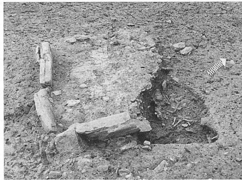
Abb. 80: Trimmis, ev. Kirchengemeindehaus. Feuerstelle mit darunterliegendem Säuglingsgrab in Bau (76). Blick von Südosten.

geordnet werden. Immerhin legt der Befund von Schlackengrübchen im weitesten Sinne die Tätigkeit von Metallbearbeitung nahe. Direkt unter der Herdstelle in Bau (76) befand sich das Grab eines Säuglings, was einem auch andernorts beobachteten Usus entspricht (Abb. 80). 126 Verstorbenen Kleinkindern wurde offenbar das Recht zugestanden, "zu Hause" zu bleiben. Die beiden am südlichsten gelegenen Bauten (76) und (264) sind einem Brand zum Opfer gefallen. Keramiktöpfe, welche sich zum Zeitpunkt des Feuersausbruchs in den Gebäuden befanden, gingen dabei in Brüche und veränderten aufgrund der grossen Hitze stel-