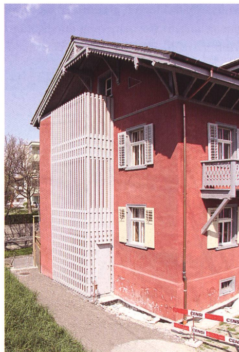
Abb. 97: Chur, Haus «Roter Turm», Nr. 188. Der Turmanbau im Osten von 1782.