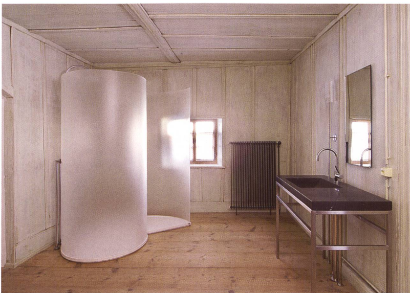
Abb. 106: Malans, Haus «von Moos», Nr. 135. Ehemalige Schlafkammer, heute Badezimmer. Bei der Restaurierung beliess man die vorgefundene Farbgebung der Wände.

Der bestehende Kalk-Verputz konnte erhalten werden. Lediglich einige schadhafte Stellen, hauptsächlich im Sockelbereich, sowie diverse Zementflicke mussten entfernt und neu aufgebaut werden. Auch hier