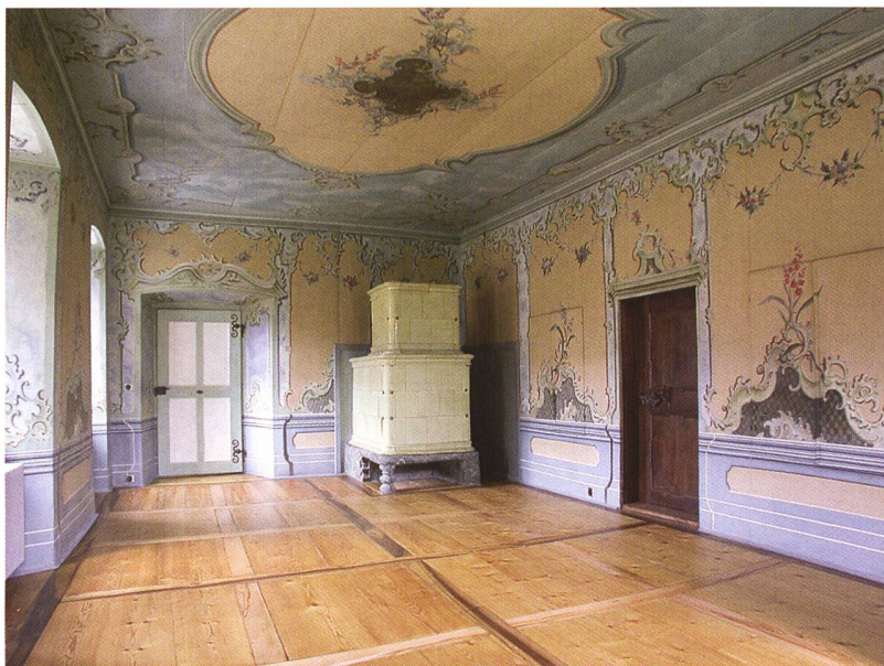
Abb. 111: Zizers, Oberes Schloss, Nr. 18. Rokokosaal im Hochparterre mit dem Steckborner Kachelofen von 1722.

Baudenkmal erfolgreich abgeschlossen werden. Der Familie Kilchenmann-Theus wünschen wir alles Gute für ihr Wohnen in alten Gemäuern.