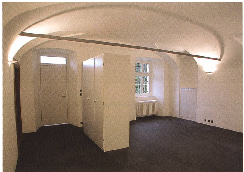
Abb. 110: Zizers, Oberes Schloss, Nr. 18. Mittelkorridor mit originalem Terrazzoboden.

Abb. 109: Zizers, Oberes Schloss, Nr. 18. Küche mit statischer Verstärkung des flachen Gewölbes.