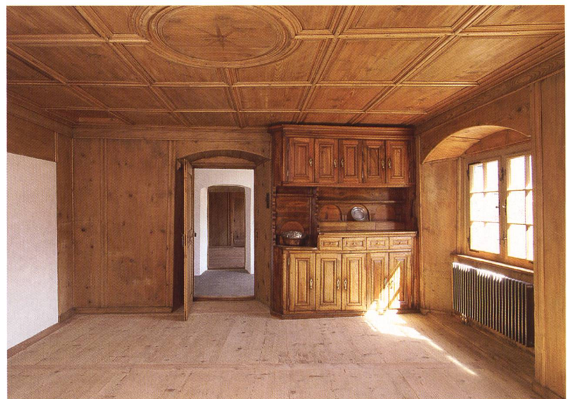
Abb. 104: Malans, Haus «von Moos», Nr. 135. Wohngeschoss. Ehemalige westliche Stube mit dem originalen Buffet, heute Esszimmer.