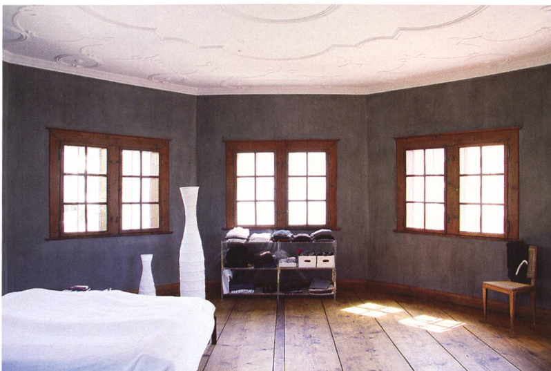
Abb. 99: Chur, Haus «Roter Turm», Nr. 188. Im ehemaligen oberen Festsaal mit barocker Ausstattung befindet sich neu das Schlafzimmer.

male Erhaltung der historischen Bausubstanz zu erreichen. Neue Elemente sind in einer zeitgemässen Gestaltung umgesetzt. Der «Rote Turm» dient heute als Familienwohnung.