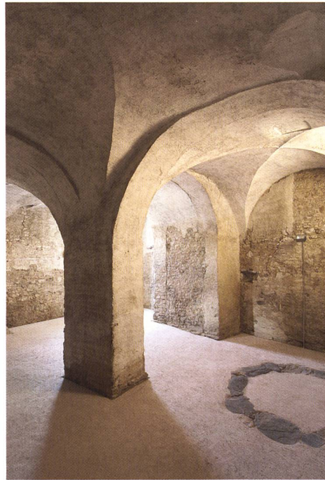
Abb. 103: Malans, Haus «von Moos», Nr. 135. Ehemaliger Torkel, heute zum Festsaal mit Fussbodenheizung ausgebaut.

vor. Nach der intensiven Prüfung verschiedener Varianten traf der Bauherr die eher ungewöhnliche Entscheidung, in diesem grossen Doppelhaus mit Stall, Torkel und zweigeschossigem, leerem Dachgeschoss