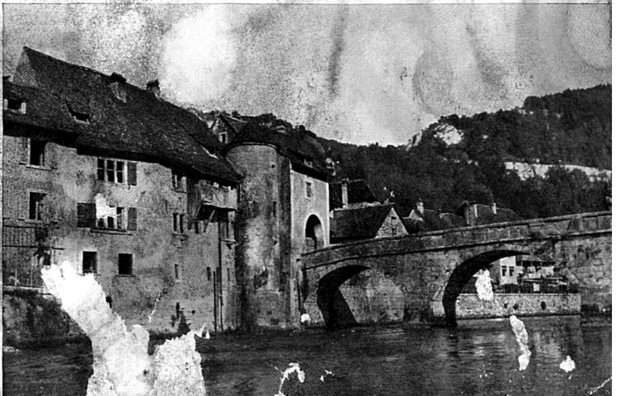
-UF ANNE e Doubs