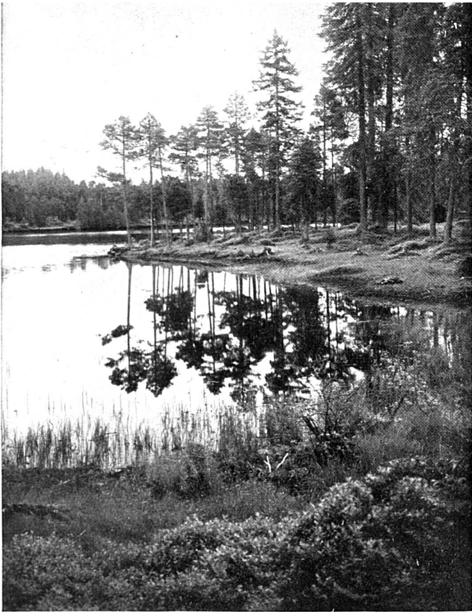
L'ÉTANG DE LA GRUYÈRE à proximité de la route de Tramelan à Saignelégier