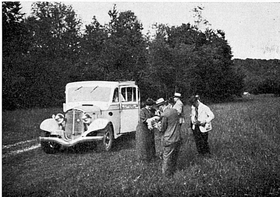
Le pillage des champs de narcisses de Damvant : La grande expédition

En Ajoie, le mouvement pour la protection de la nature est, en fait, inexistant. Porrentruy, la capitale, ne donne pas toujours l'exemple de ce qu'il faut faire dans ce sens. Précisons, pour ne vexer personne, qu'il ne s'agit ici ni d'urbanisme, ni d'embellisse-