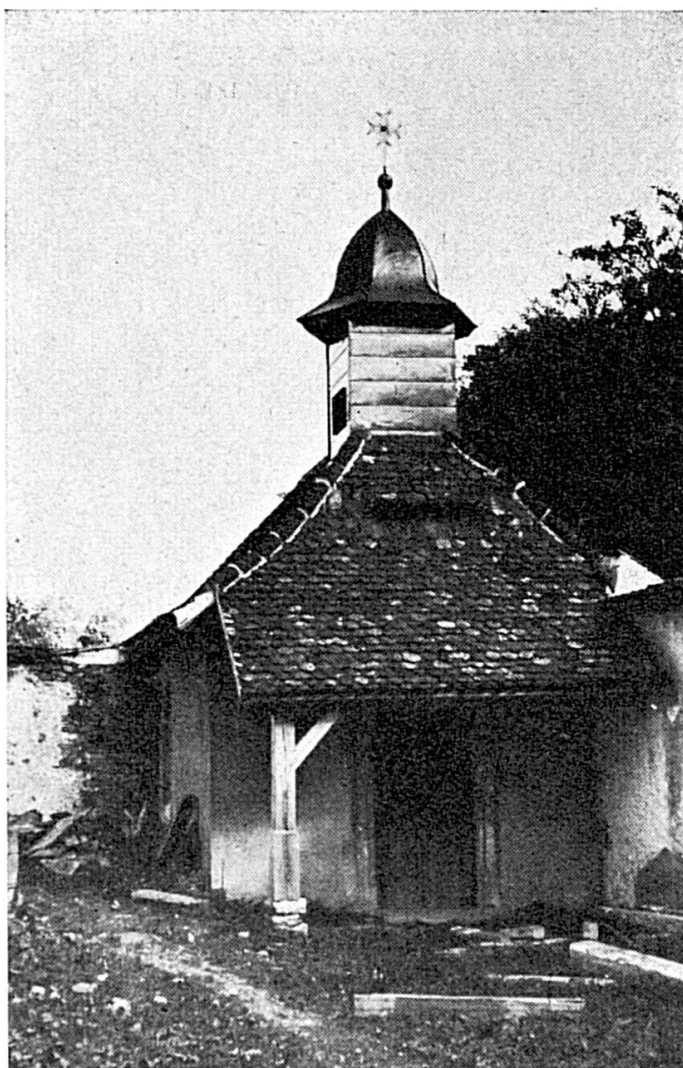
La chapelle rénovée de Raymontpierre.