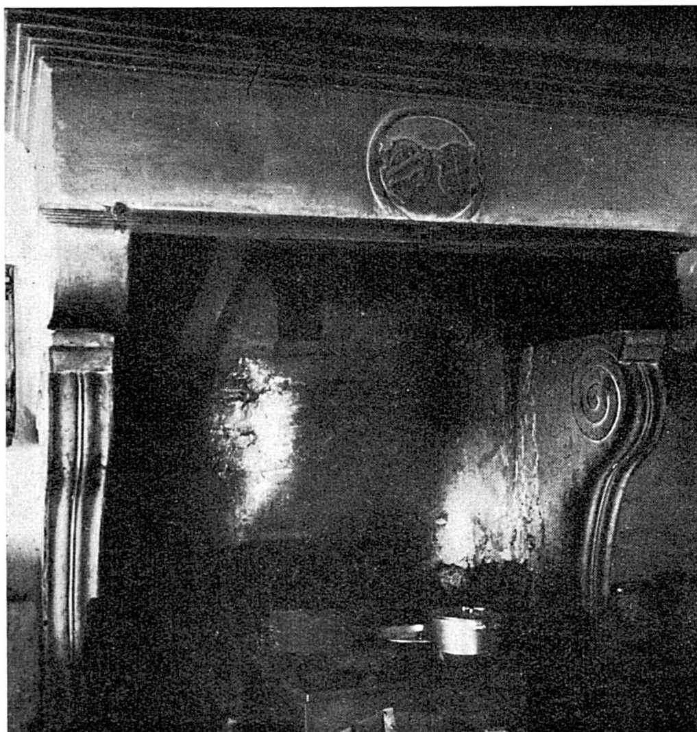
Manteau de la cheminée de la salle des chevaliers