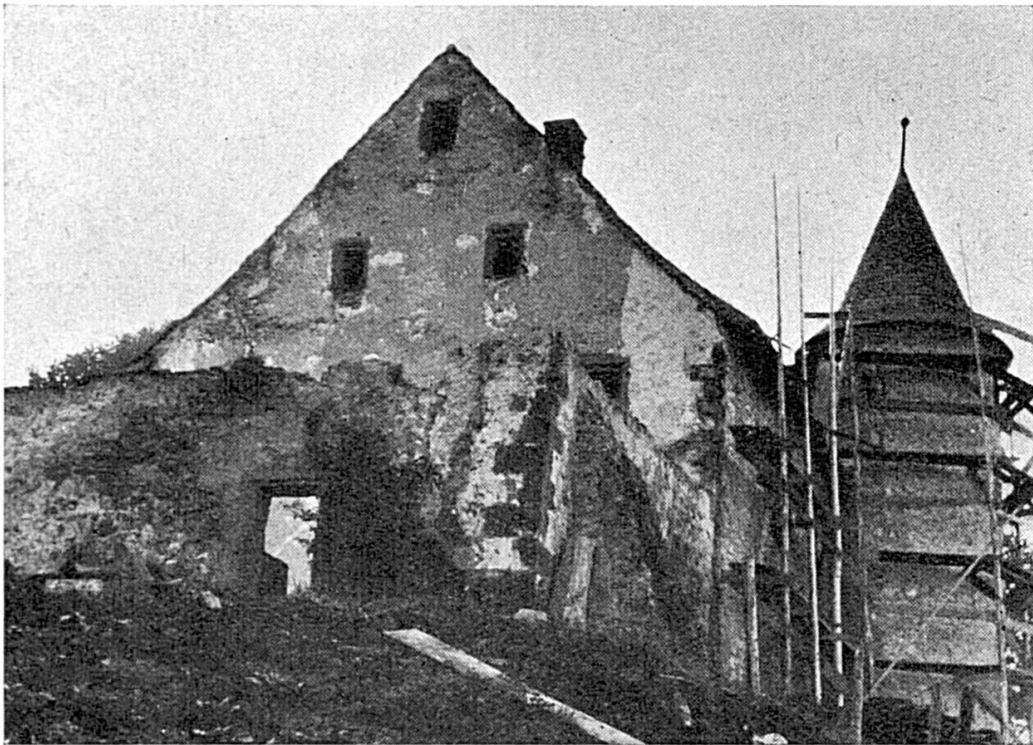
Le château de Raymontpierre, vu du nord-est.