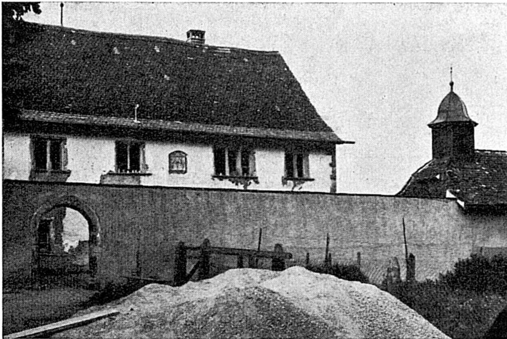
Le château de Raymontpierre