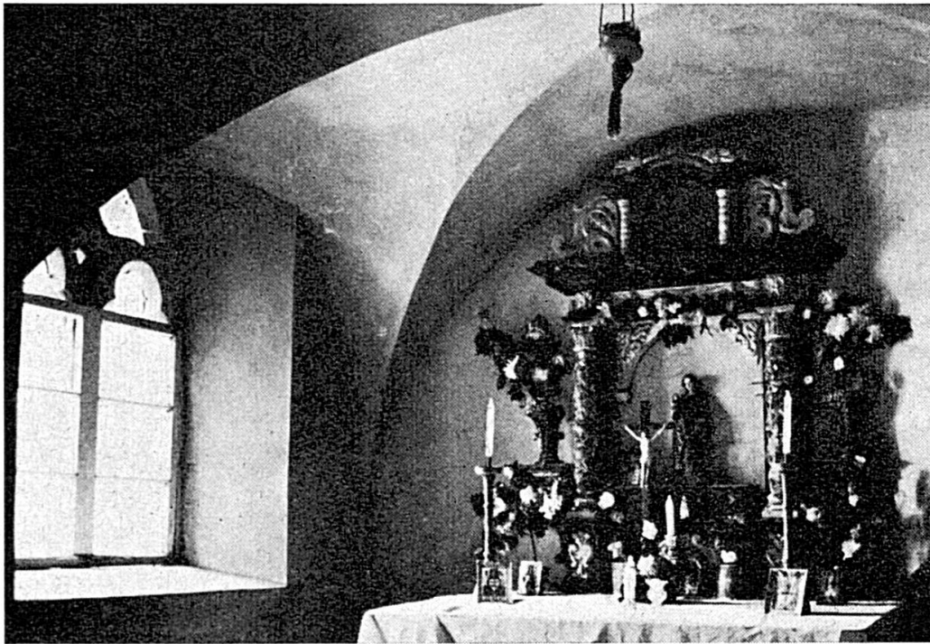
Intérieur de la chapelle de Raymontpierre.