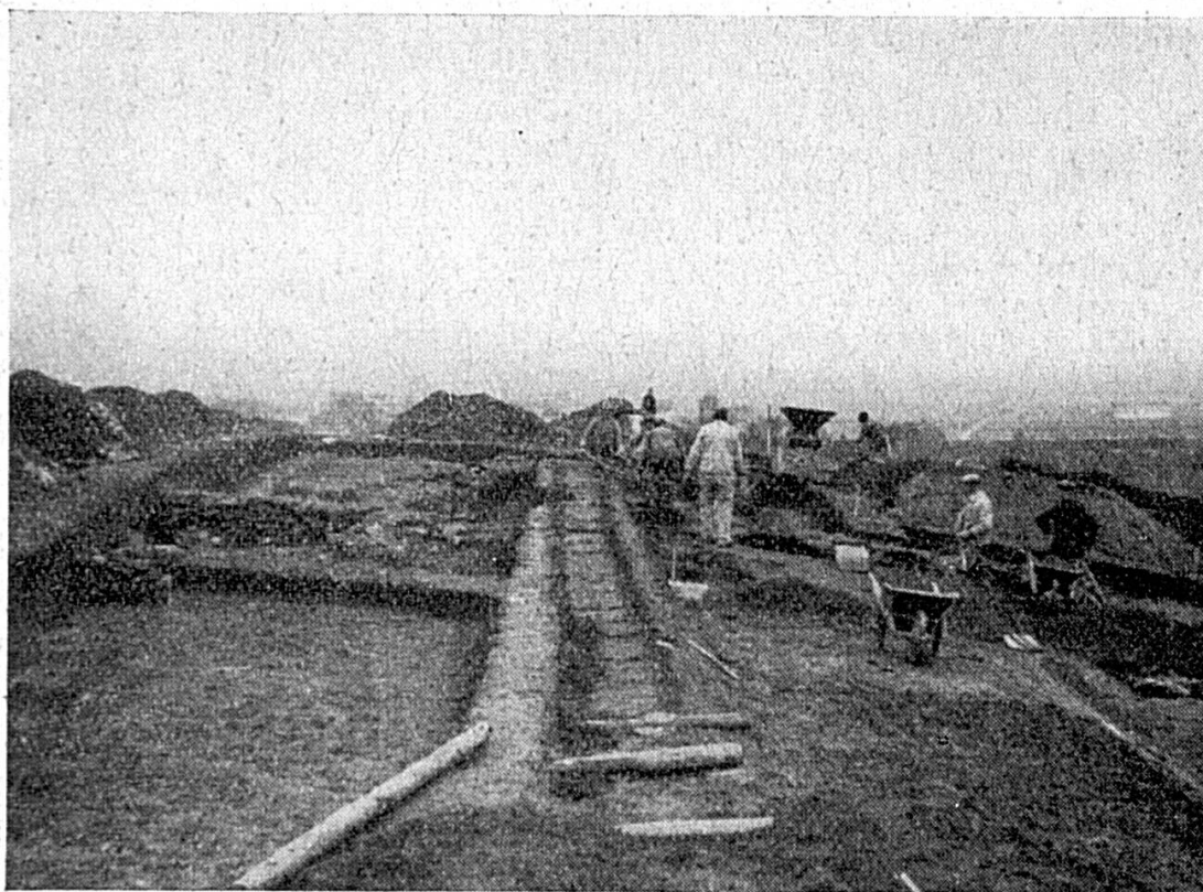
Vue du champ des fouilles