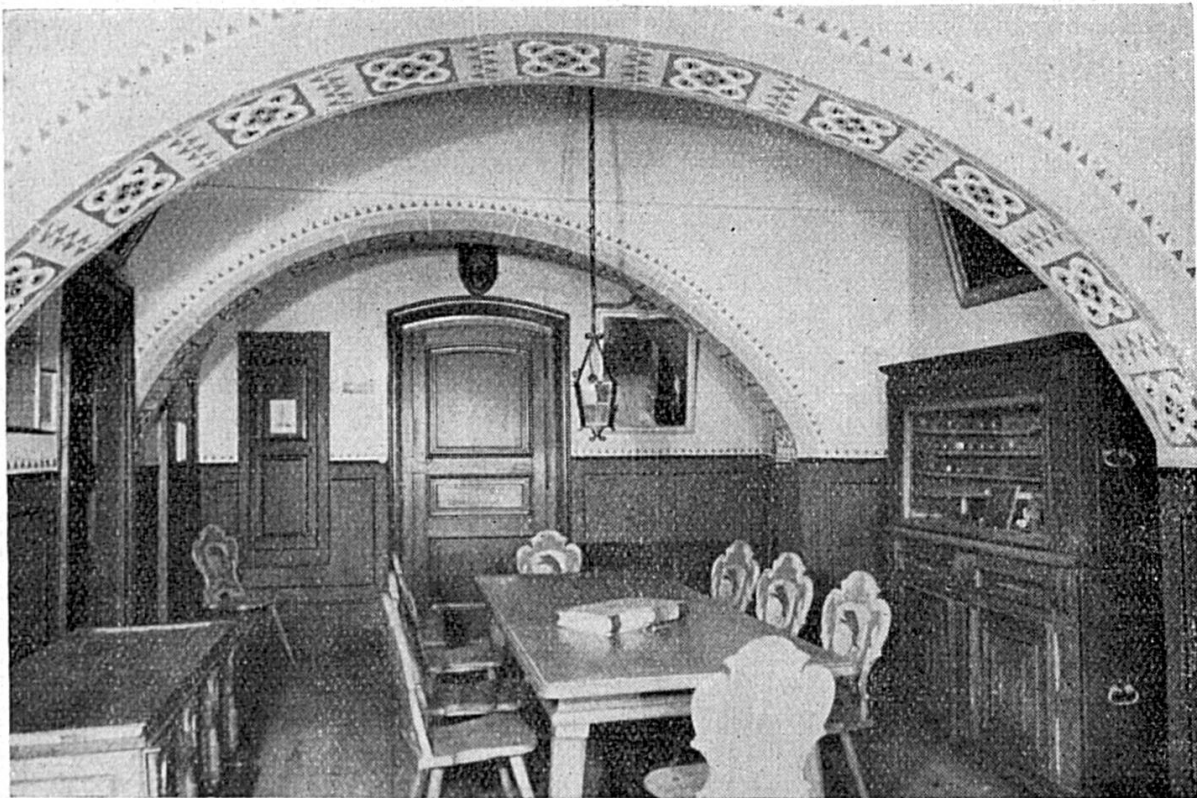
Salle de la Bourgeoisie de Porrentruy : Une pierre de taille d'une arche porte la date 1531 ADIJ 254