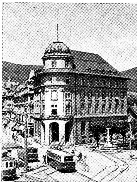
Hôtel de la Banque à Bienne