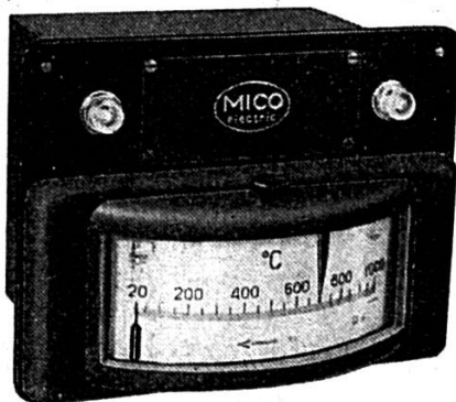
Régulateur électronique de température pour thermo-couple Hoskins Etendue de mesure : 20 — 1000° C

CIE. DES INSTRUMENTS DE MESURES ELECTRIQUES S. à r. l. BIENNE (Suisse) 22 rue de l'Hôpital, Tél. (032) 2 81 56