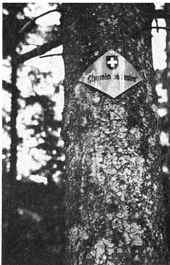
La marque intermédiaire