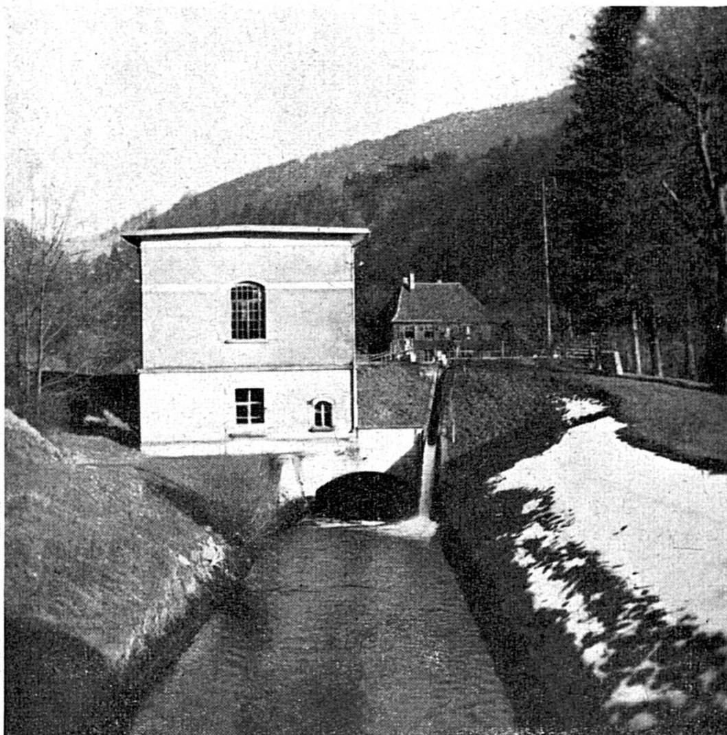
L'ancienne centrale de Bellefontaine

tant il est vrai que les entreprises nouvelles sont toujours séduisantes et d'autant plus que la nôtre va se dérouler sur un fond d'histoire que nous aurions de la peine à vous taire.