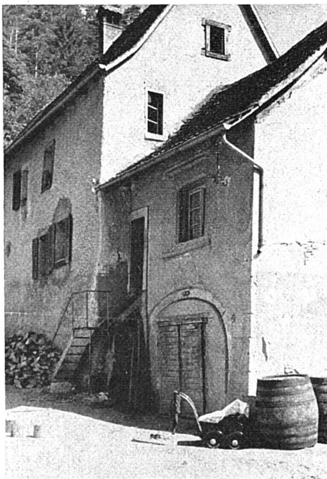
Vue du côté ouest avec les arcs maçonnés et l'escalier extérieur en fer.