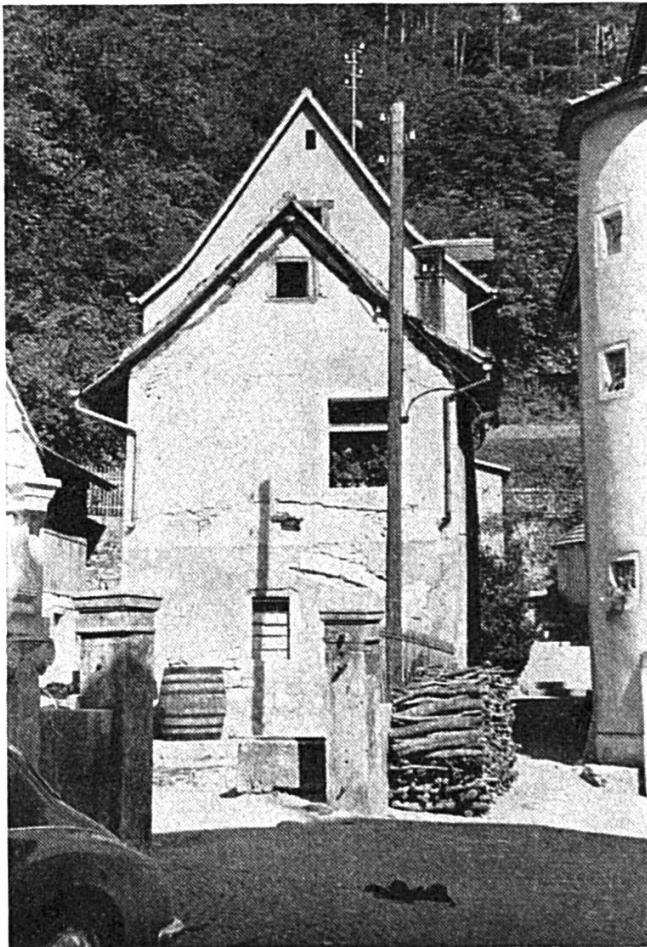
Vue depuis la route du bâtiment avant la restauration. L'arc maçonné de la voûte du rez-de-chaussée est bien visible.