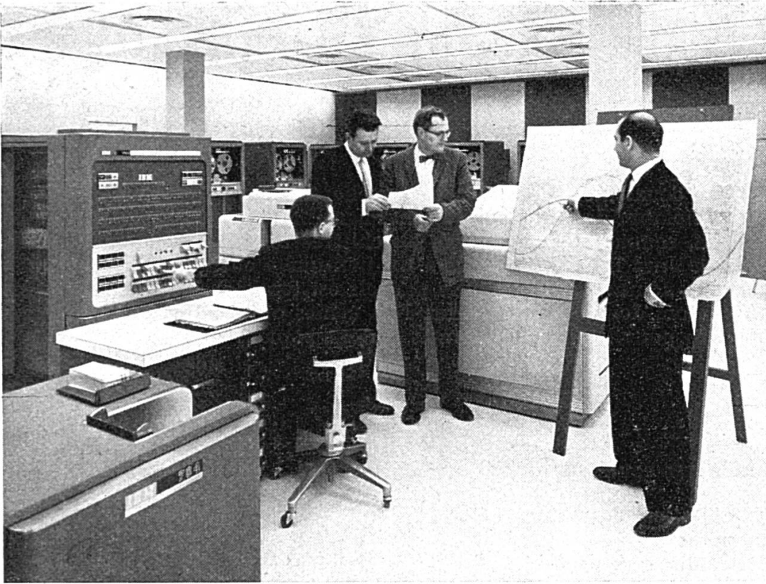
Le calculateur 3 BM géant 704 est utilisé pour calculer les orbites de satellites artificiels. Il est capable de donner la position d'un satellite à la seconde près et à chaque point où il passera au-dessus de la terre.