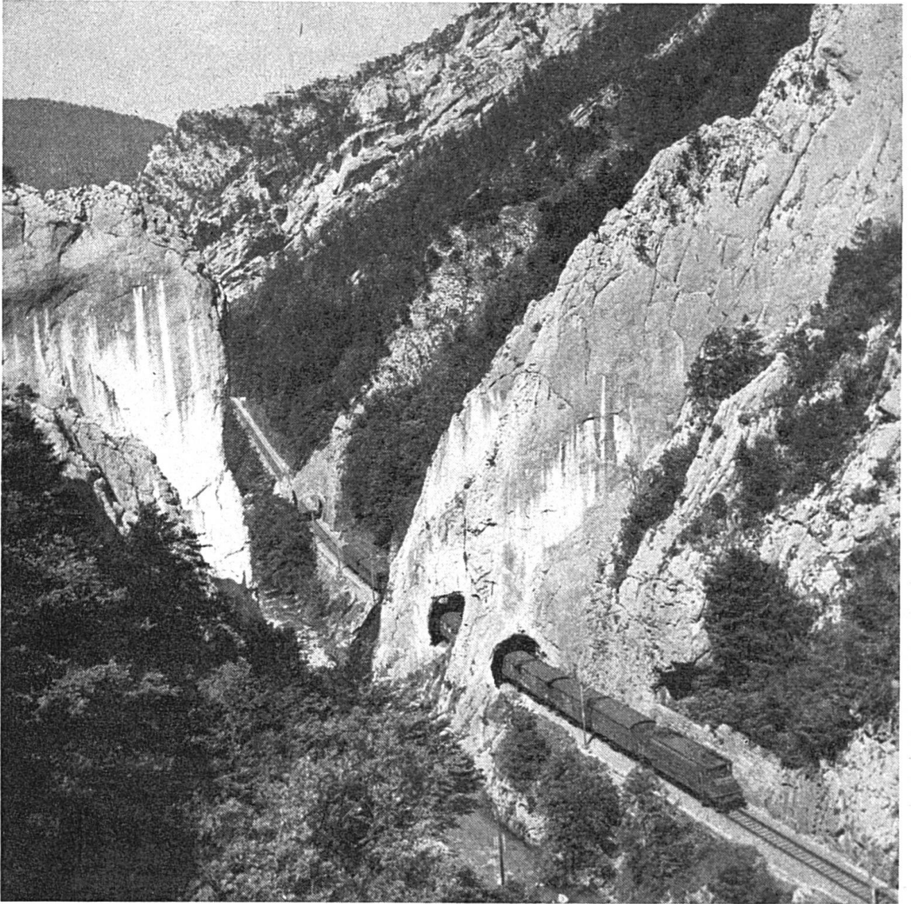
La voie unique entre Choindex et Moutier