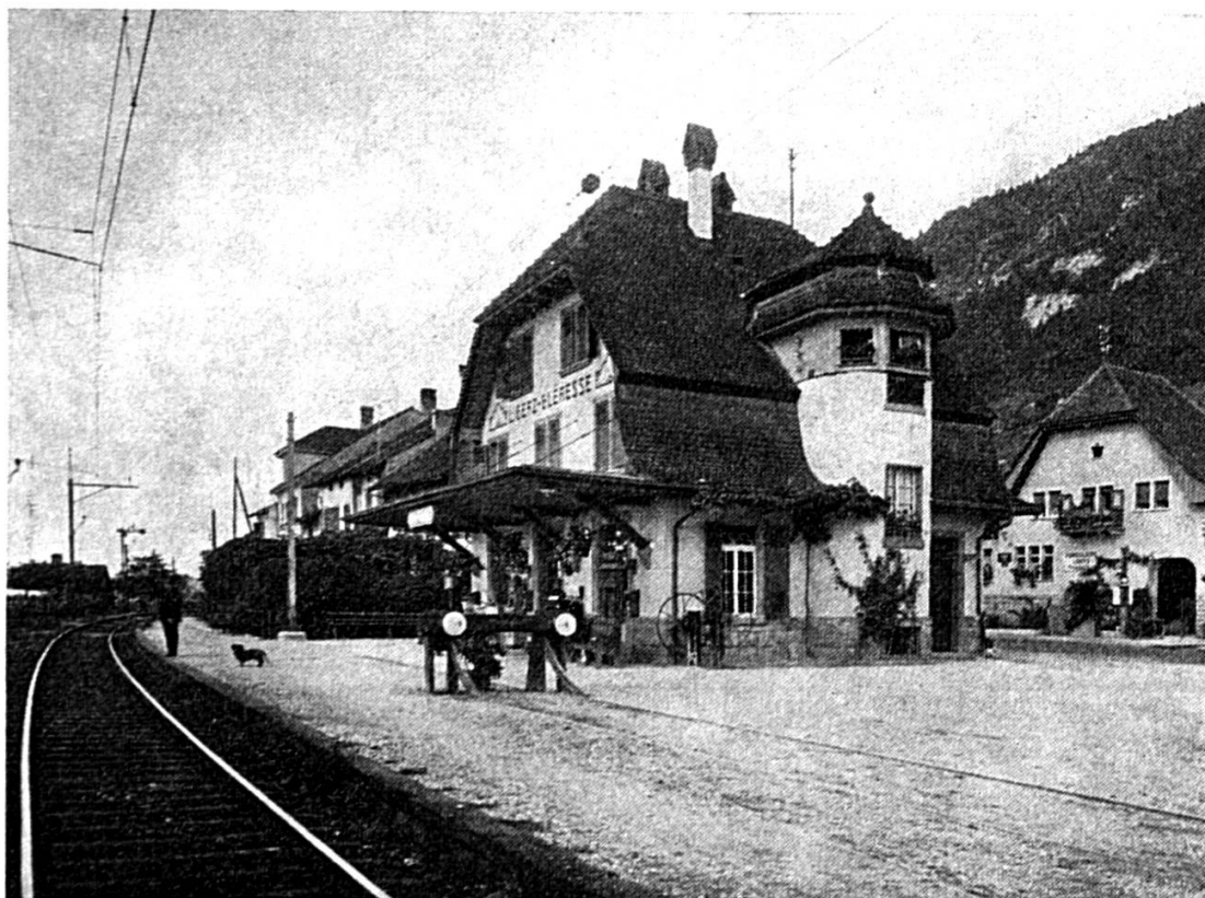
Ligerz (Gléresse) où un nouveau quai sera établi côté lac tandis que la voie en cul-de-sac sera supprimée.

Passages à niveau. — Les quarante-huit passages à niveau du tronçon seront remplacés par dix-huit passages inférieurs et par un chemin longeant le rivage. Trois postes de garde-barrière disparaîtront et cinq passages inférieurs existants seront améliorés.