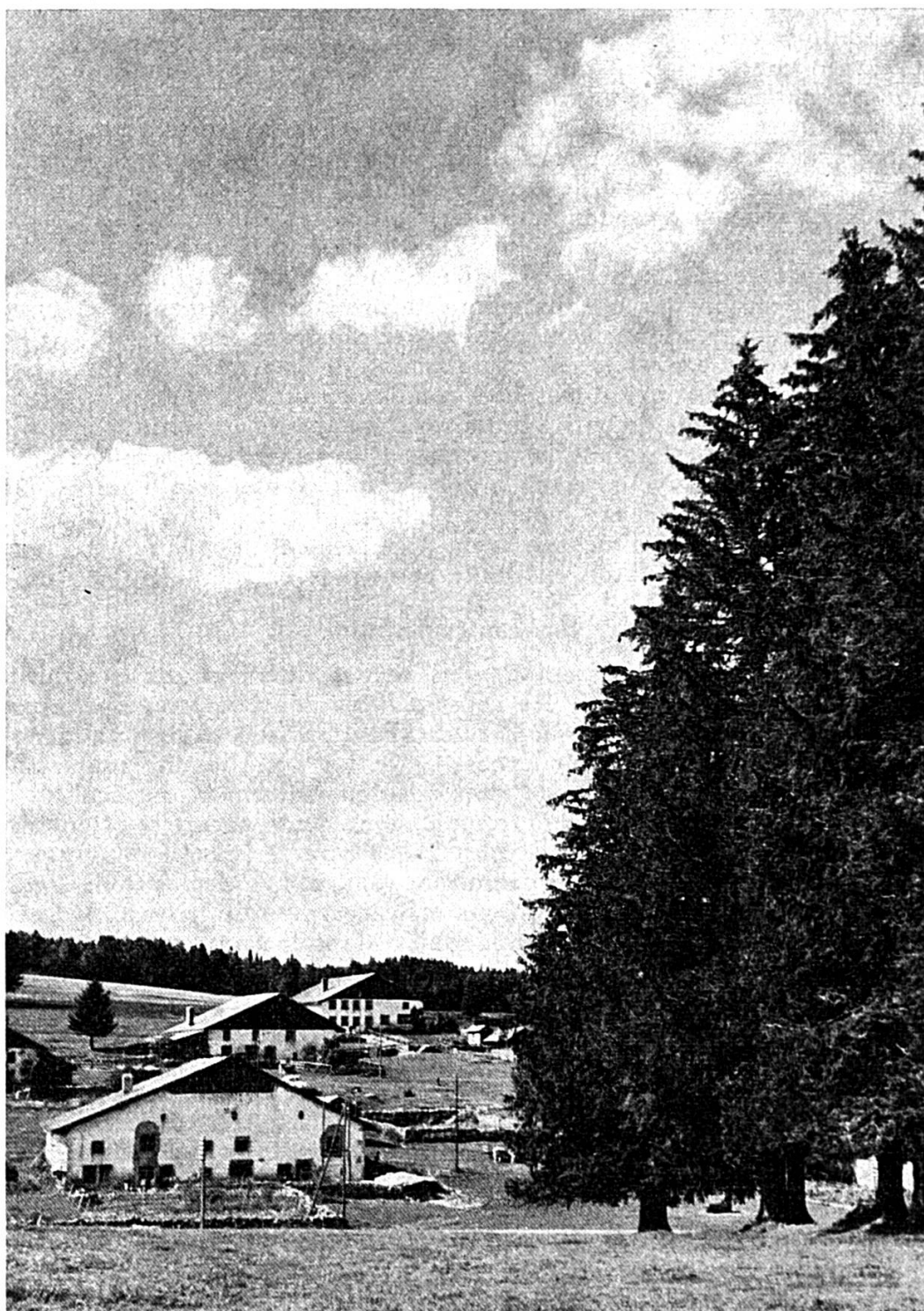
Paysage des Franches-Montagnes