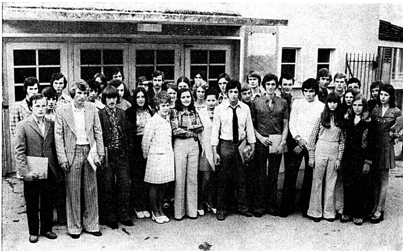
Les apprentis méritants