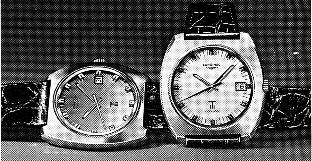
Réf. 8477 Ultronic. Electronique à diapason. Précision de l'ordre de la minute par mois. Etanche. Date. Disponible en acier, plaqué or et en or.

Depuis plus d'un demi-siècle Longines contribue à l'amélioration des performances sportives mondiales par la qualité et la précision de ses chronométrages.