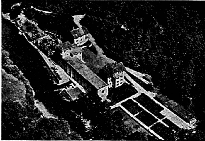
USINE DE LA GOULE SUR LE DOUBS