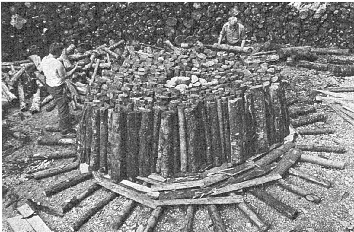
Les charbonniers construisent le premier étage. Au centre, les rondins blancs constituent la cheminée.

Les rondins sont recouverts de dosses de sapin qui formeront ainsi un plancher sur lequel les billettes destinées à être carbonisées sont dressées. Elles sont légèrement inclinées de manière à obtenir finalement un tronc de cône parfait. La perche est dressée dans la cheminée et sert de guide pour la suite de la construction qui n'est qu'une répétition du montage du premier étage. Le