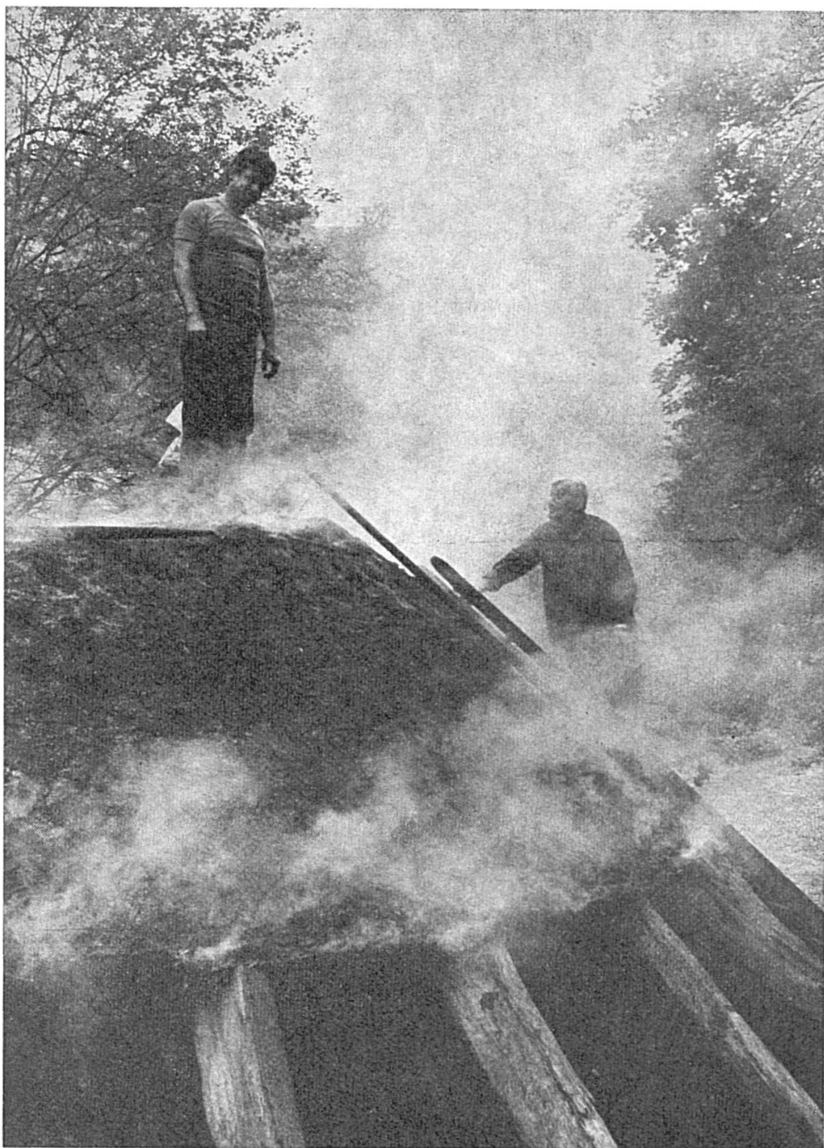
Les charbonniers contrôlent la cuisson.