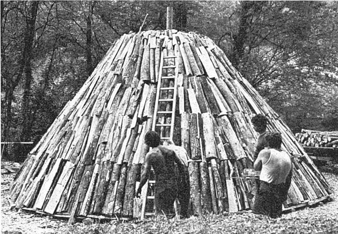
La flintion nécessite beaucoup de travail.

cœur de sapin est maintenu rigide à l'aide de clous afin que la perche puisse être retirée sans trop grandes difficultés. La confection du dernier étage nécessite beaucoup de travail car il s'agit d'obtenir un sommet de cône parfaitement arrondi. Enfin, tous les trous apparents doivent être bouchés avec des morceaux de bois. Notons au passage que les billettes de tous diamètres peuvent être carbonisées. L'important est que la surface apparente soit la plus unie et la plus régulière possible.