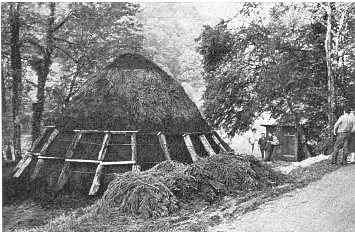
Le poussier est appliqué contre la couverture de branches d'épicéas. A l'arrière-plan, la cabane du charbonnier.

Le feu à l'intérieur est alimenté par la charbonnette et le bois versés par la cheminée. Toutes les deux heures, puis toutes les trois ou cinq heures, le charbonnier enlève le couvercle, enfonce une longue perche dans la cheminée, la secoue fortement en la retirant afin d'activer le feu. A la suite de cette opération, il se produit un trou plus ou moins profond au sommet de la cheminée que l'on remplit de charbonnette. Le couvercle est remis en place et recouvert de poussier.