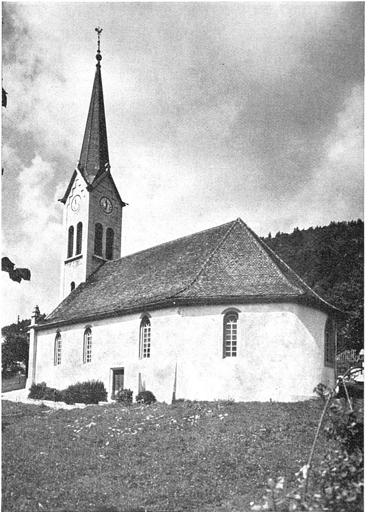
La haute flèche de l'église : Il n'y a pas que les sapins pour élever l'homme...