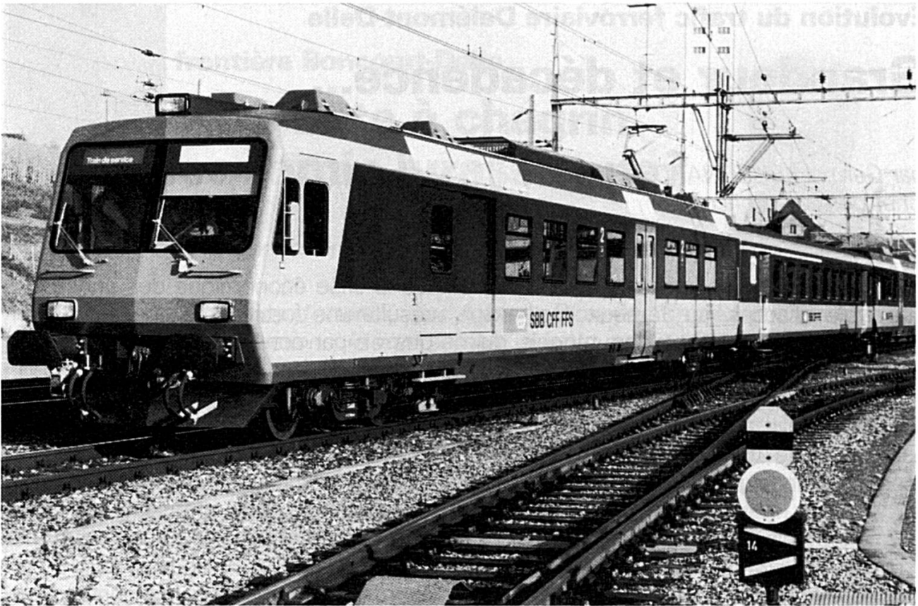
Les nouvelles rames interrégionales ne devraient pas ignorer la chaîne jurassienne.

CFF de Delle en 1935 et son transfert à Porrentruy n'apporta pas les avantages escomptés. Un tel déclin menaçait d'aboutir à l'abandon de la « porte d'entrée » de Delle-Frontière, surtout après les années mortes de la guerre 1939-1945.