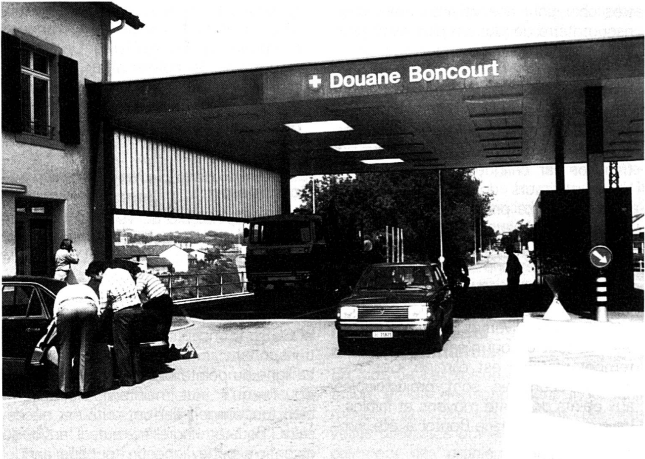
« Nous pourrions faire face à un doublement du trafic » assurent les douaniers.