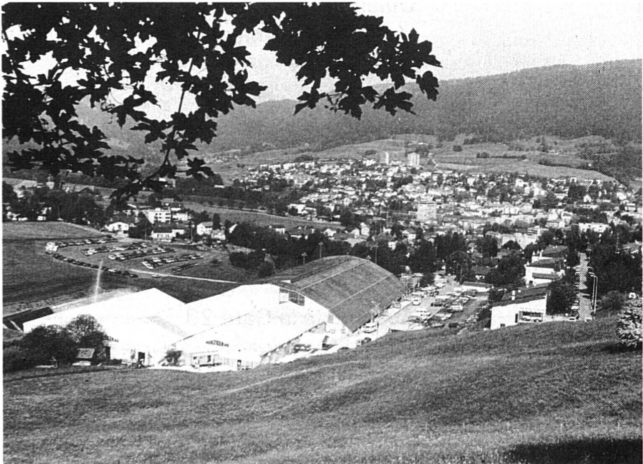
Le site du SIAMS en 1992, dans le prolongement de la patinoire couverte prévôtoise avec, en arrière-plan, la ville de Moutier.

Le SIAMS, vitrine du monde industriel moderne, ne faillira pas à sa mission ; plus encore que par le passé il sera au service des entreprises. Elles seules sont capables d'assurer la prospérité de cet Arc jurassien transfrontalier des microtechniques, de l'industrie de précision, de la machine-outils et du décolletage dont notre région est le centre.