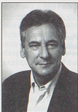
par Blaise Oriet, Secrétaire général de la Chambre jurassienne d'agriculture