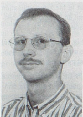
Par Vincent Chappuis