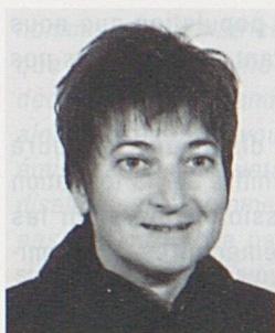
par Madeleine Froidevaux, Association Lire et Ecrire, Bienne.