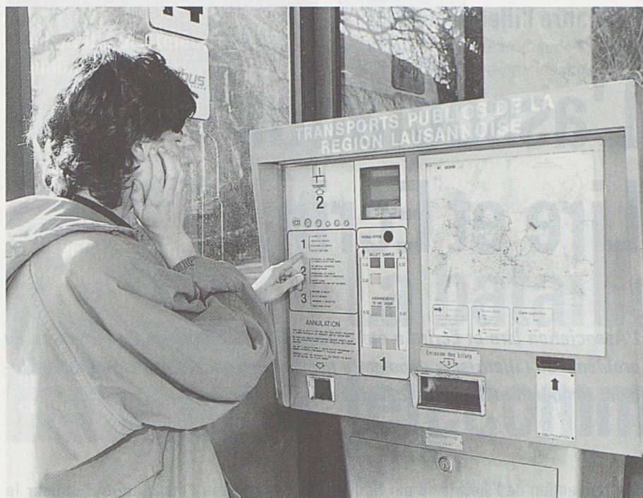
L'incapacité de déchiffrer ou de comprendre un texte simple constitue un grave handicap dans une société où les exigences vont croissant....

de 20 ans et plus résidant en Suisse sont plutôt alarmantes. (Voir tableau de la page précédente).