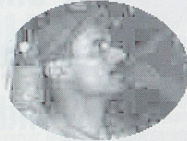
Agrandissement d'une partie de l'image définition 1 ko