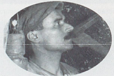
Agrandissement d'une partie de l'image haute définition 178 ko

IM@JURA : une association nouvellement créée afin de sauvegarder et de mettre en valeur le patrimoine photographique de nos régions. Elle rassemble d'ores et déjà une quantité impressionnante de documents.