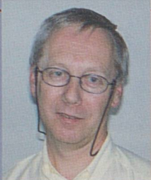
par Michel Antoine