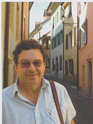
Par Jean-Paul Bovée

Economiste, professeur chargé d'enseignement à la Haute Ecole Arc Economie