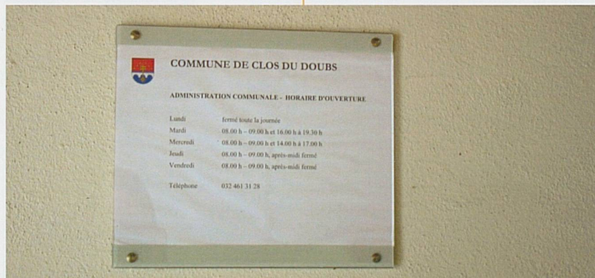
Une simple feuille A4 collée au mur indique l'administration de la commune de Clos-du-Doubs

La commune de Soubey a été approchée pour l'aider à résoudre les problèmes récurrents qu'elle rencontrait pour constituer ses autorités. Le rapprochement était imaginable aussi bien du côté des Francs-Montagnes que du Clos-du-Doubs. Les respon-