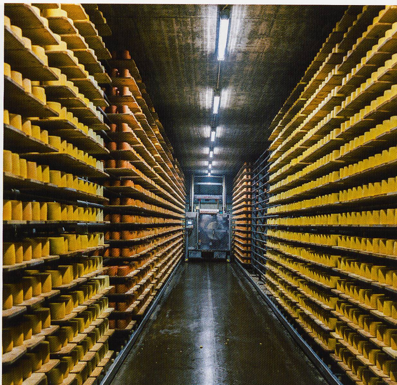
La Tête de Moine AOP, spécialité de notre région, ne s'est jamais aussi bien (ex)portée qu'en 2019.