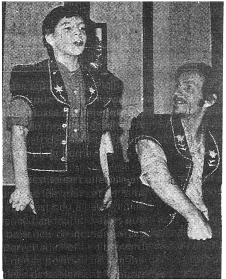
Le « bouebo » et le « barlatè ».

Puis, c'est la vie de la montagne avec ses travaux, ses repas frugaux, ses conversations près de l'âtre. Soudain, une catastrophe ! La fièvre aphteuse s'abat sur le troupeau. Le vétérinaire arrive. Il prescrit d'énergiques mesures de désinfection. Au moment où celle-ci sont en oeuvre, un bidon de chaux vive bascule sur le maître-fromager et lui inonde le visage. Le voilà aveugle ! On le retrouve plus tard au village, marchant à tâtons avec une canne blanche. Son amie ne l'a pas lâché. Mais elle se fait chasser de la maison, parce qu'elle veut quand même l'épouser. Avec un beau courage, le couple s'unit. Il met au monde des enfants. Mais onze ans plus tard, miracle ! Un éminent chirurgien de Genève réussit à guérir l'aveugle. Ce dernier