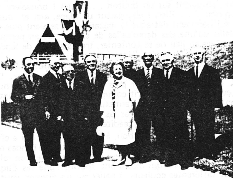
Le Conseil des patoisants romands, en été 1964, Exposition nationale suisse, à Vidy-Lausanne.

A propos de photo, voici celle du Conseil des Patoisants romands, à l'issue de sa séance tenue à l'EXPO, le dimanche 31 mai. (Journée des Savoyards).