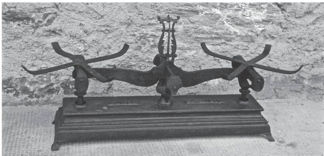
La balanhyi dè la mama.

La vie, c'est comme un compte en banque, on peut retirer que ce qu'on a mis dessus. Alors, je vous encourage à beaucoup mettre sur votre compte en banque des bons souvenirs. Oubliez les mauvais moments, les rages et les soucis de la vie. Semez, donnez votre joie. Ne comptez pas trop sur les autres. Une vie simple vous préparera une belle place au pays du bon Dieu. »