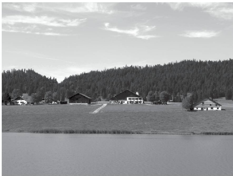
Le lac des Taillères avec l'entaille naturelle de l'Ecrena en arrière plan.

Ce nom, vient du patois encranne . Une encranne , c'est une entaille et donc, un encrann'ment , c'est un droit de mettre une ou plusieurs bêtes sur le pâturage communal. Chaque premier printemps, le garde-champêtre de la commune, l'encrannou , est (était) chargé d'enregistrer les bovins et les chevaux qui seraient lâchés sur les pâturages. Dans le temps, alors qu'il n'y avait pas d'ordinateurs et qu'on ne prenait pas de carnets ni de marques, l'encrannou faisait des entailles avec un couteau sur deux planchettes de bois. Une de ces planchettes restait chez le secrétaire communal et l'autre chez le paysan. Ainsi personne ne pouvait tricher ! Alors ces entailles s'appelaient bien sûr les encrannes . Et bien, c'est par une gigantesque encranne naturelle que la route passe de France en Suisse à la douane de ... l'Ecrena !