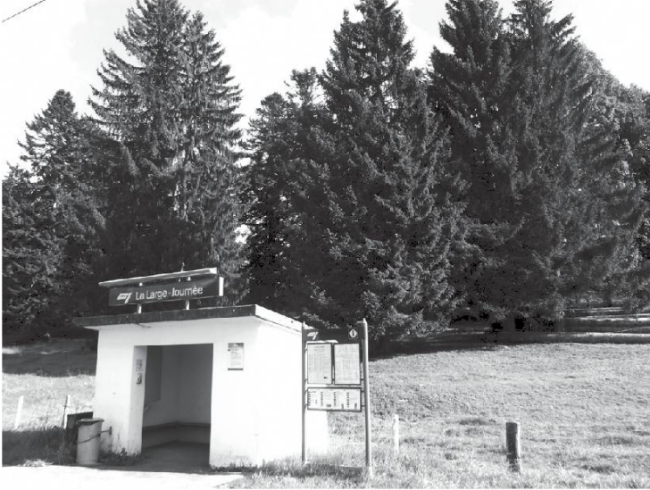
La halte CJ de La Large-Journée et un des domaines de La Large-Journée.