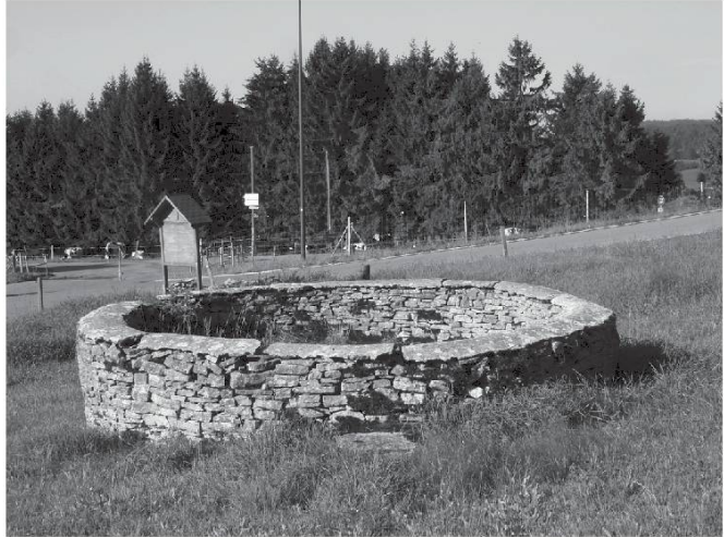
Citerne à Enson-lai-Fin.

An r'trôve encoé l'yûenyme Enson dains pus d'in âtre yue : Enson- Paroisse dains l' Chios di Doubs JU, La Faux-d'Enson en Hâte- Aidjoûe JU obîn encoé Enson- Martel dev'ni Som-Martel dains l' neutchétlous Jura.