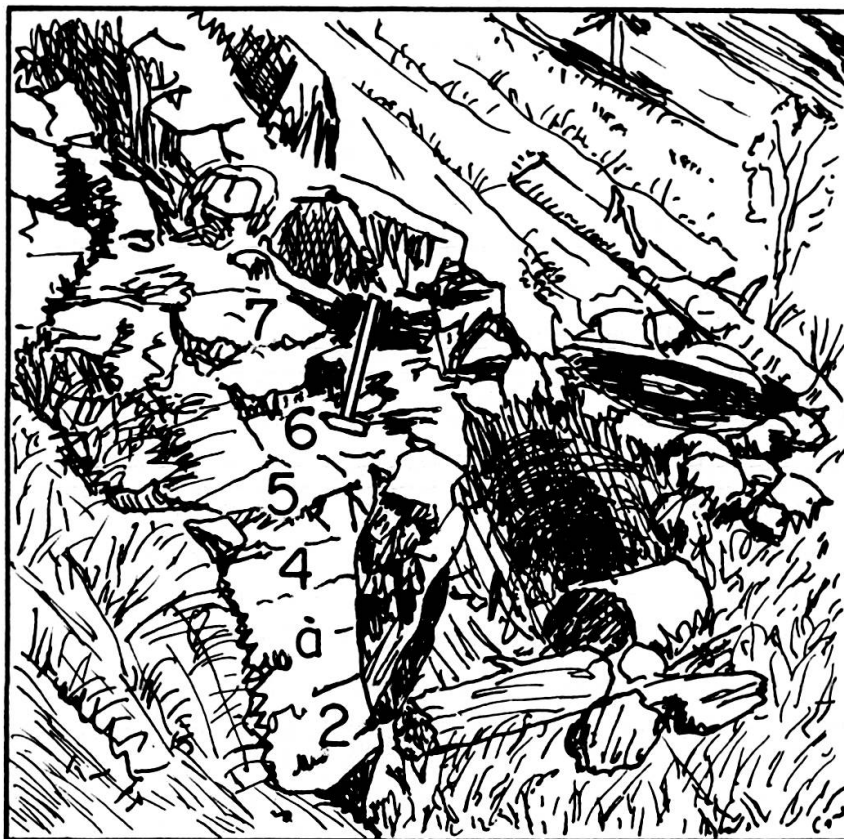
FIG. 2. — Le rocher de la Fontaine aux Ammonites. Les numéros sont ceux des niveaux de la coupe de PETERHANS, 1926. (marteau: 50 cm.).

Ajoutons ici que dans le talus de la route passant au-dessus de la coupe de la Fontaine aux Ammonites, on a de bas en haut: