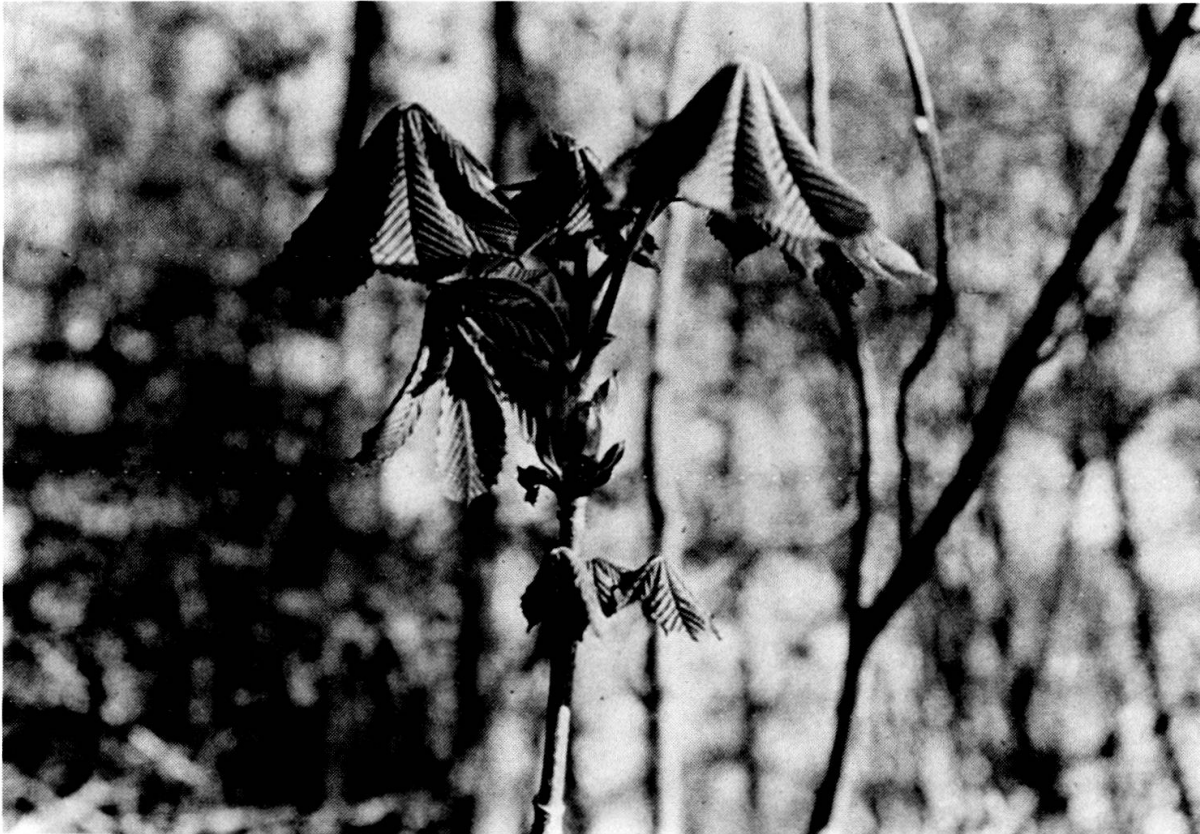
FIG. 2. — Déploiement des premières feuilles d'un bourgeon de marronnier.

à 1831 (24 ans). Entre 1818 et 1831, nous avons l'avantage de posséder une double information puisque deux arbres ont été simultanément observés. Elle permet d'apprécier le comportement de deux marronniers différents. Quelques écarts se remarquent mais généralement ils sont minimes et souvent l'ouverture a lieu le même jour. Si l'on