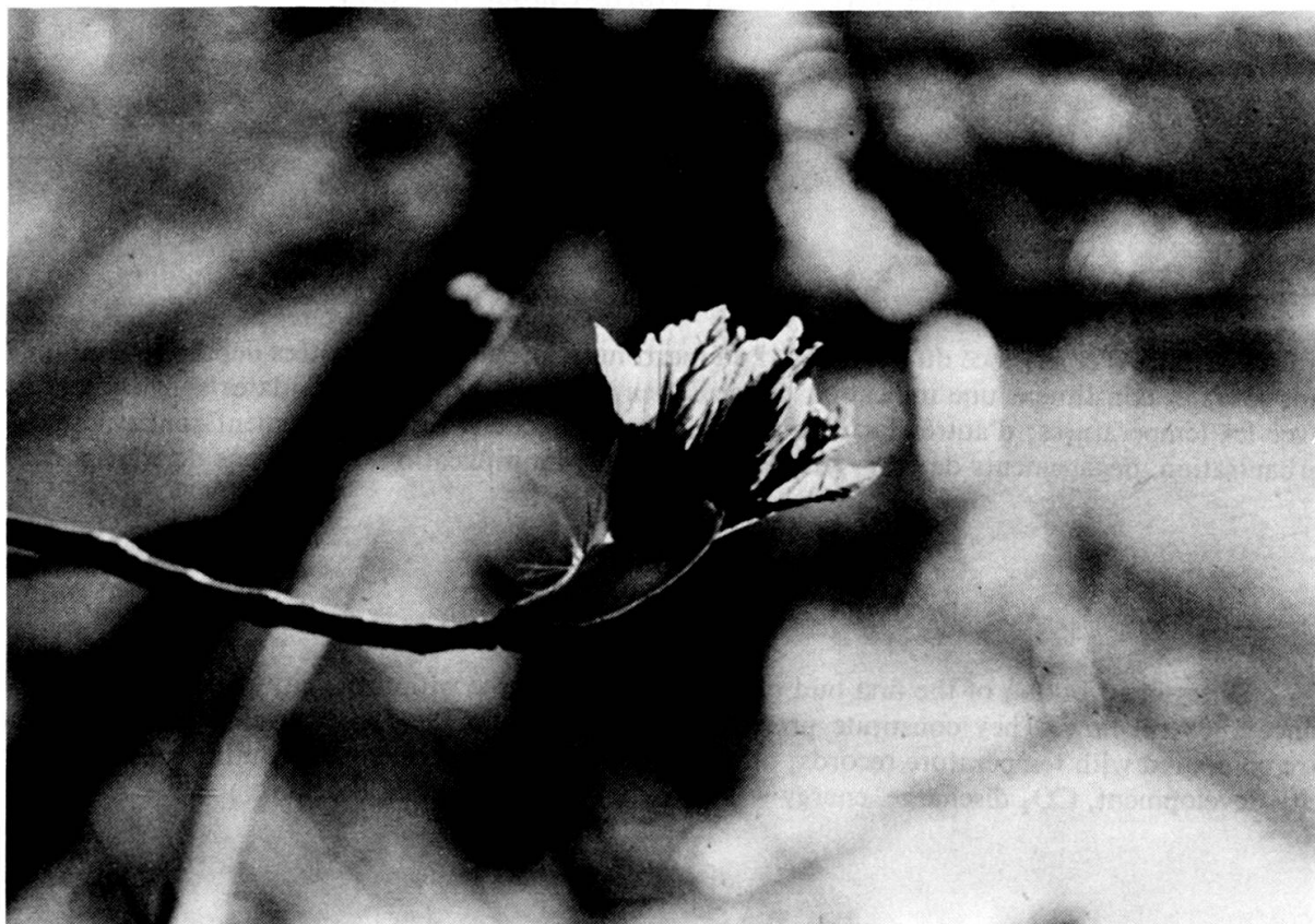
FIG. 1. — Bourgeon de marronnier en éclosion.

De marronnier en marronnier, de sautier en sautier, la tradition s'est perpétuée; elle demeure de nos jours encore bien vivante et chaque année les journaux relèvent fidèlement l'événement. Nous disposons ainsi d'une suite d'observations qui couvrent 175 années.