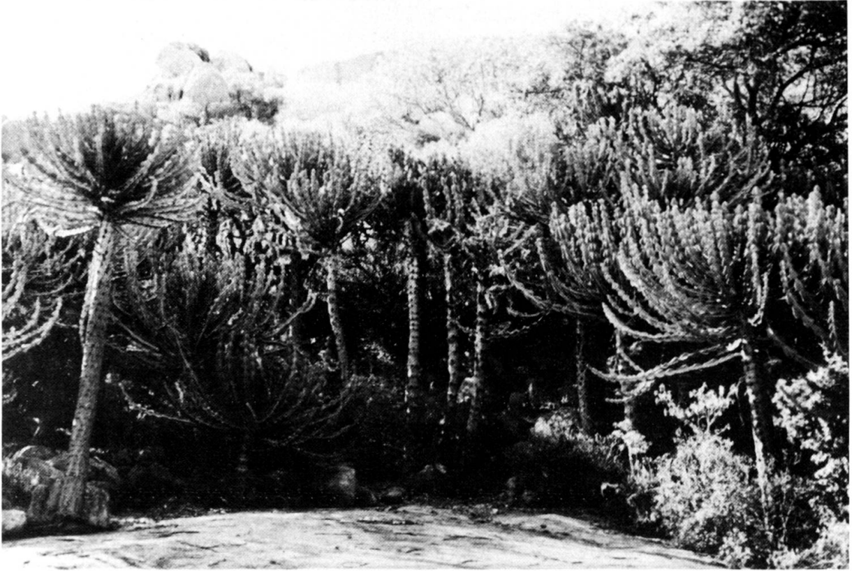
Euphorbia cooperi dans le Bushveld.