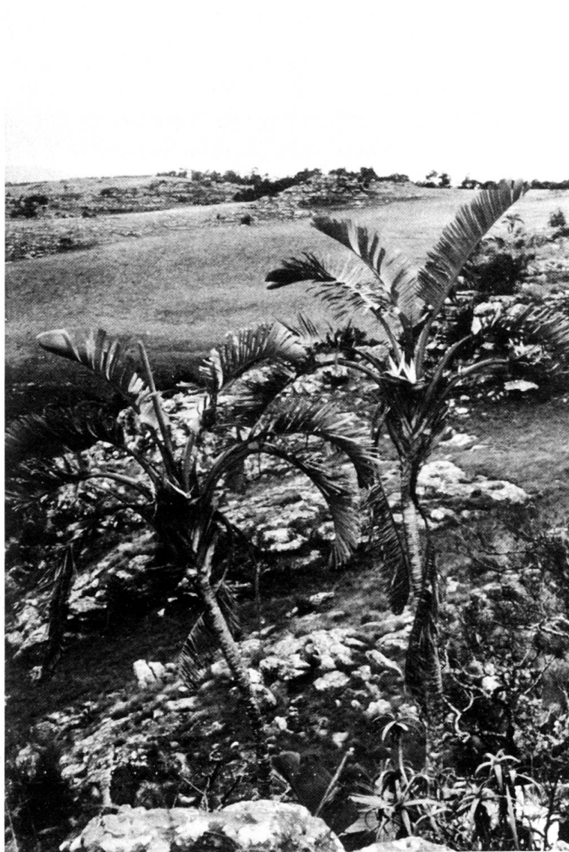
Strelitzia nicolai dans les «grasslands» du Natal avec Rhipsalis baccifera dans les rochers.

Nous poursuivons notre route sur la province sud-africaine du Natal. Cette dernière porte ce nom depuis que Vasco de Gama y mit le pied le premier en 1497 et vit l'importance des richesses que l'on pouvait tirer de ces territoires nouvellement conquis. Depuis, les comptoirs se sont multipliés le long de la côte est de l'Afrique. Cette région est fertile et abondamment irriguée par tout un réseau hydrographique en provenance de la chaîne du Drakensberg. L'intégralité de la côte longeant l'océan Indien est très largement exploitée soit pour l'agriculture (notamment la canne à