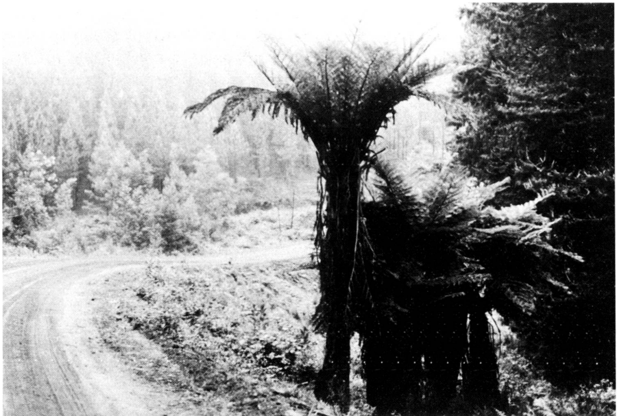
Cyathea dregei (fougère arborescente) sur l'escarpement du Drakensberg au nord du Zvaziland.