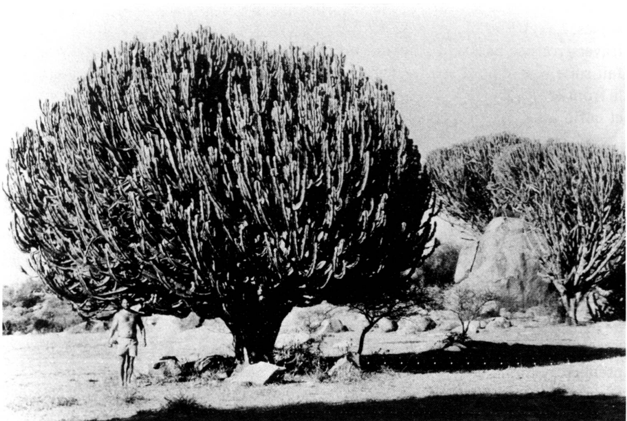
Euphorbia ingens : Tropique du Capricorne.