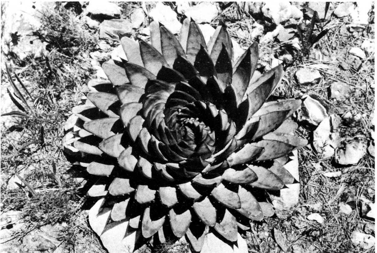
Aloe polyphylla endémique du Lesotho.