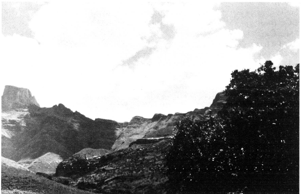
Le Drakensberg au Mont aux Sources avec Greyia sutherlandii au premier plan.

Nous ferons plusieurs approches du Drakensberg qui sur son flanc oriental apparaît comme une barrière difficile à franchir. Divers accès néanmoins sont possibles sur des pistes moyennement confortables. Cette région de montagne, isolée dans les nuages et la neige une partie de l'année, n'était autrefois fréquentée que par des tribus de Bushmen. Exterminés à la fin du siècle passé par la colonisation de l'homme blanc et surtout par la domination de diverses tribus rivales, il n'en reste plus actuellement que le souvenir dans des reconstitutions en cire représentant des scènes de la vie quotidienne et quelques peintures rupestres dans des abris sous roche. Malgré tout, en l'absence des indigènes Bushmen, le Drakensberg reste un haut lieu de la vie sauvage telle qu'elle a dû se présenter à leurs yeux aux temps protohistoriques. Plusieurs réserves protègent ces sites uniques où faune et flore ont acquis un équilibre établi sur des millénaires. La végétation dominante est celle des prairies grasses déjà rencontrées (KILLICK, 1963, 1978a, 1978b). Les sols sont très acides (pH 5,5 à 6,5) composés presque exclusivement de l'altération des roches basaltiques sous-jacentes. Ils sont peu épais de 15 à 30 cm d'épaisseur, bruns et granuleux. La stratification