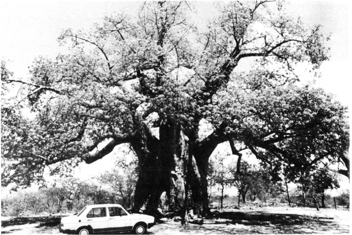
Adansonia digitata dans le Lowveld.