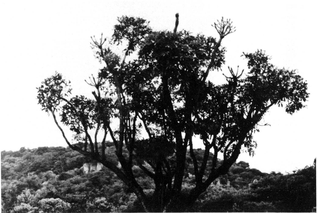
Cussonia transvaalensis (ARALIACEAE) dans le Soutspanberg.