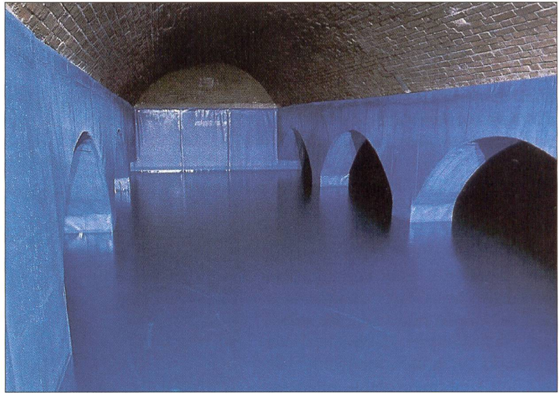
Réservoir d'eau potable

Les besoins en investissements pour atteindre les Objectifs de développement du Millénaire visés par l'ONU en 2000 et réduire de moitié d'ici 2015 le nombre de personnes n'ayant pas accès à l'eau potable et à l'assainissement sont gigantesques.